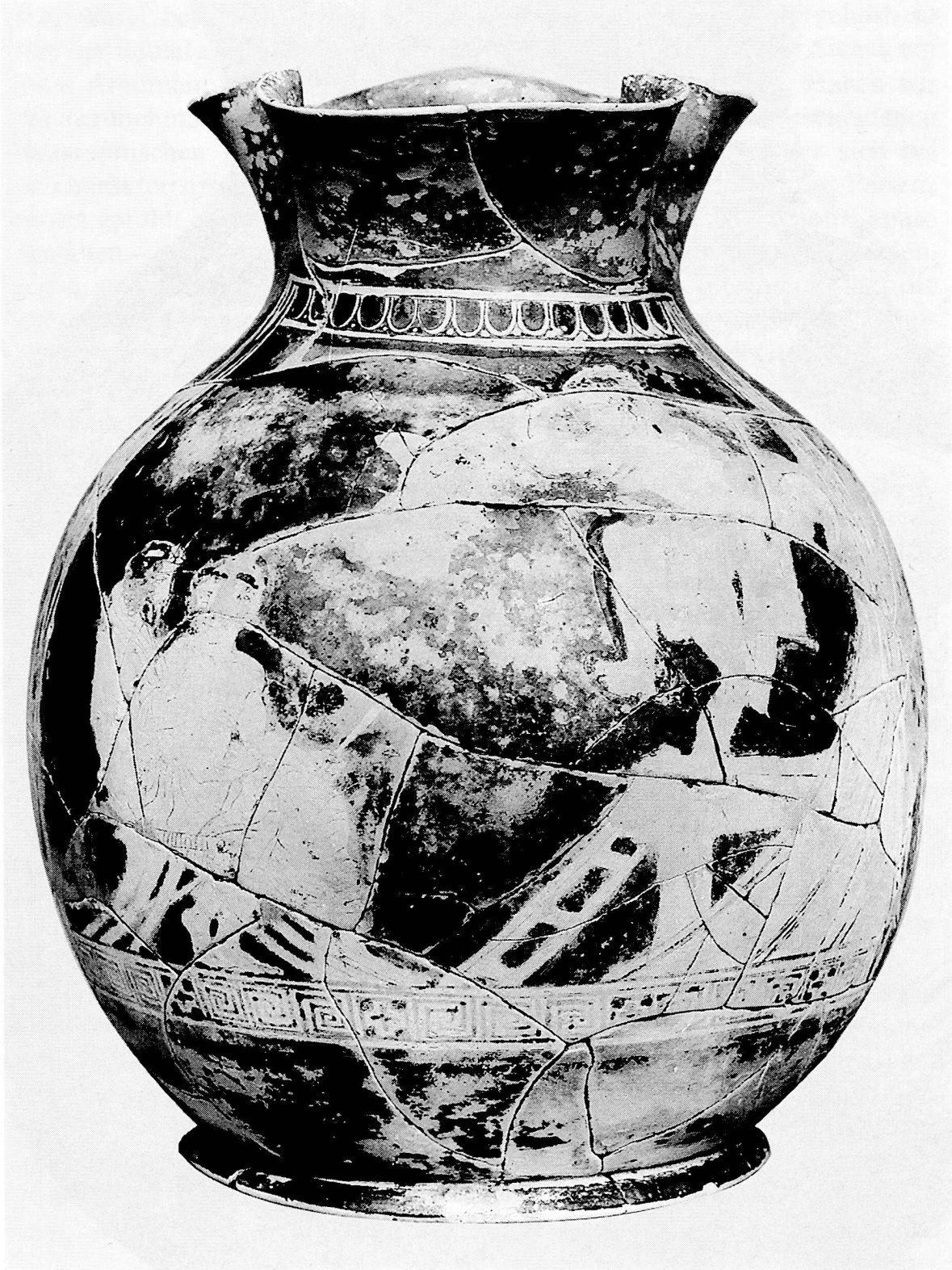
Tafel 1. Kanne Vlastos: tatsächlicher Zustand.