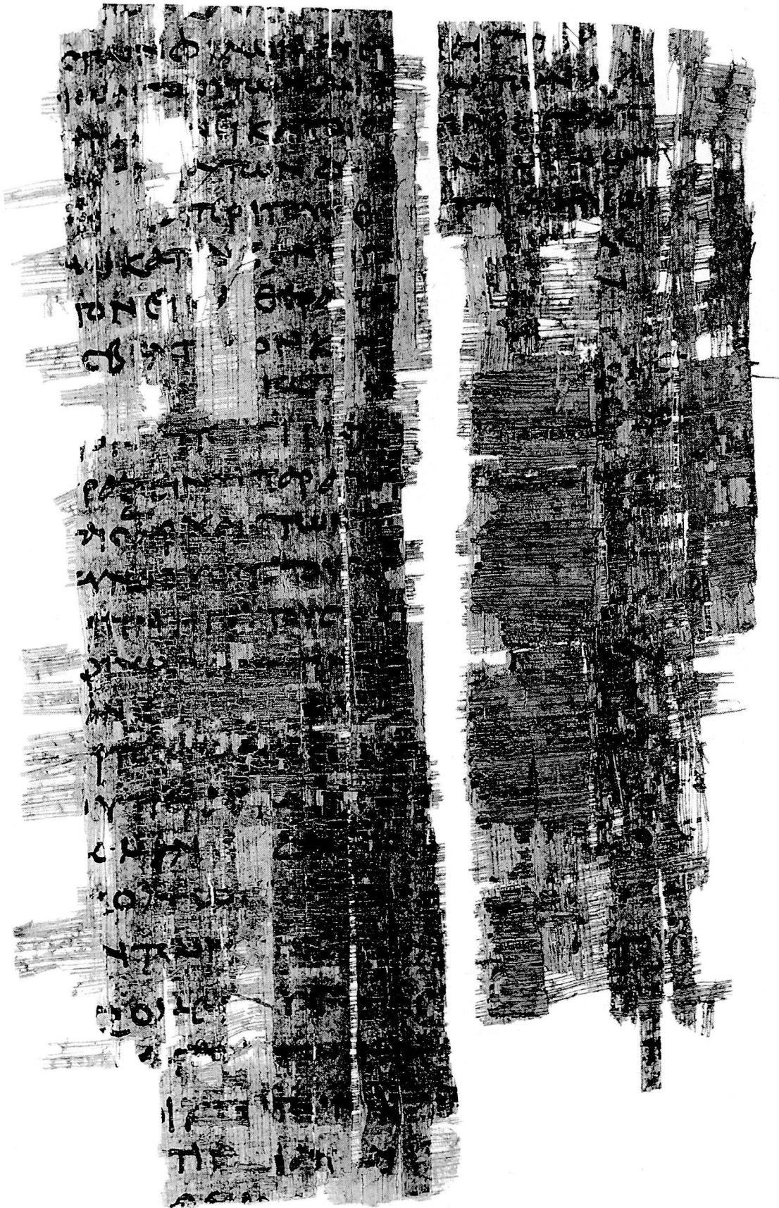
Planche 2 P. Bodmer LII verso, collection Martin Bodmer, Coligny (Genève)