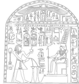
Abb. 5 Karnak] 365% Zerstörung, Behar el-Hafn nach Fincke, Reversal, Abb. 23

Beachten Sie in der folgenden Darstellung (Abb. 5) von dem Heiligum 'Thutmosis' III. in Der el-Bahari die Schriftrichtung und ihren Bezug auf die Figuren.