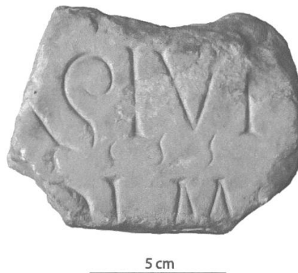
Fig. 4: Fragment d'inscription latine de Perly.

d'un M peut-être suivi d'un nouveau signe de ponctuation. Au-dessus de cette seconde ligne, la succession de petits S allongés et gravés moins profondément que les autres lettres paraît signaler la présence d'abréviations. Transcription diplomatique: