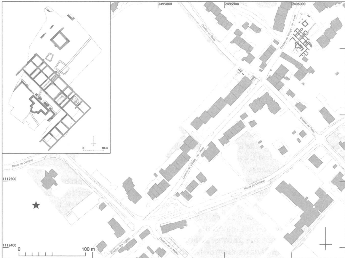
Fig. 3: Plan de situation avec le village de Perly, l'emplacement des vestiges de la villa gallo-romaine et le lieu approximatif de trouvaille de l'inscription (étoile); à gauche, plan de la villa dans son extension maximale (seconde moitié du 2 e siècle). Dessin Marion Berti, SCAGE.