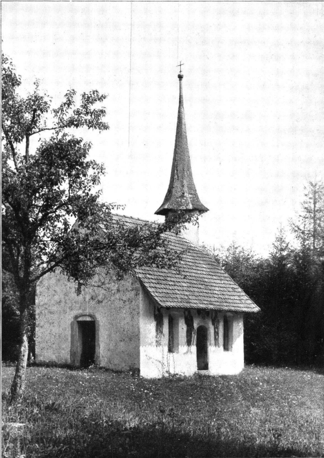
St. Magdalenen-Kapelle am Fuchsberg (Drei Eidgenossen) Pfarrei Freienbach.