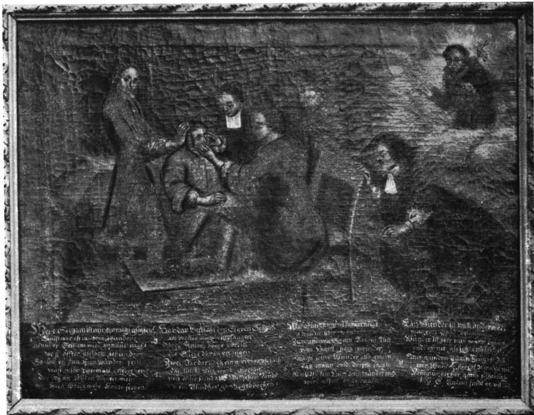
Votivbild der wunderbaren Staroperation (Bild 4)