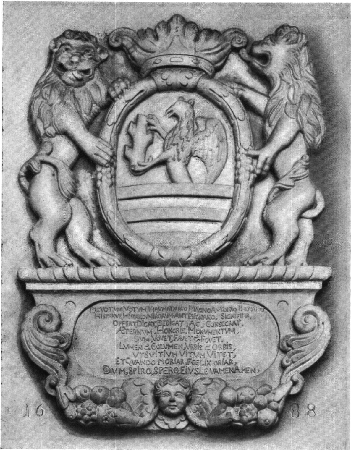
Wappen der Familie Betschart mit Weihe-Inschrift (Bild 1)