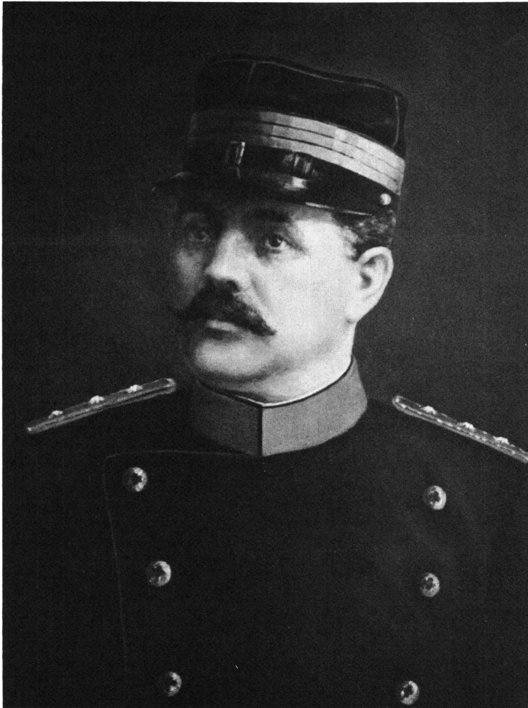
Regierungsrat Heinrich Wyß (1853–1910), Oberstdivisionär, Ölgemälde im Regierungsrats-Saal zu Schwyz von H. Lienert, 1914.