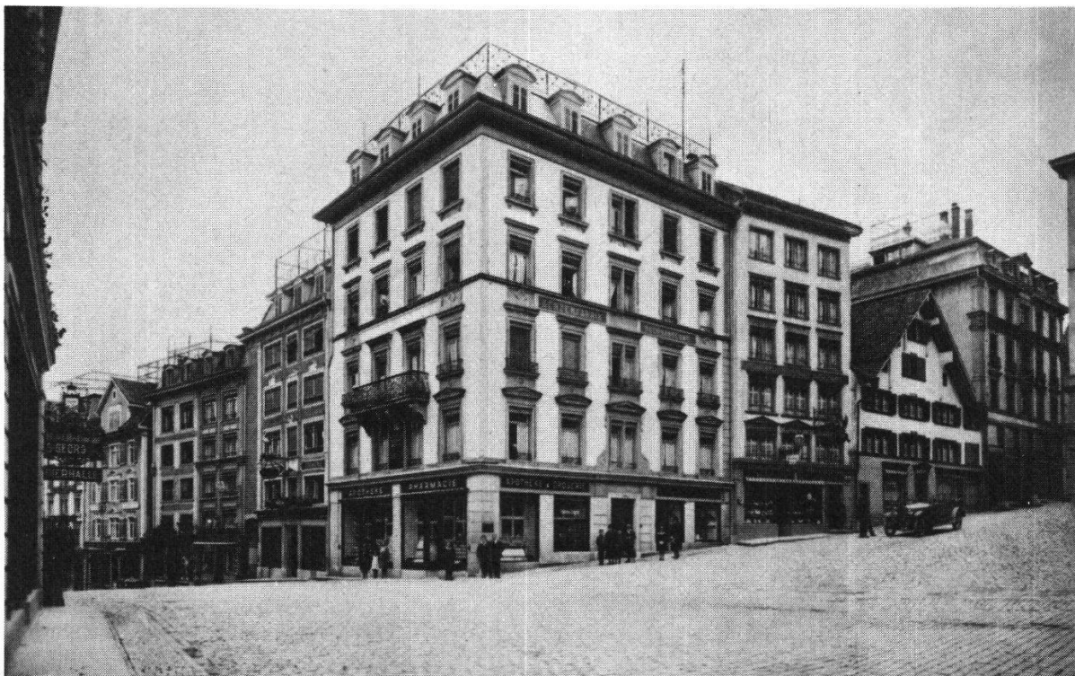
Der «Engel» zu Beginn des 20. Jahrhunderts (Aufnahme um 1935). links an der Hauptstrasse stößt der «Engel» an den «Storchen», rechts an der Strählgasse lehnt sich der «Goldene Adler» (Fischerstube) an die Apotheke.

Und damit schloß sich der Kreis um die Geschichte des alten Gast- und Geschäftshauses an der Hauptstraße der Waldstatt.