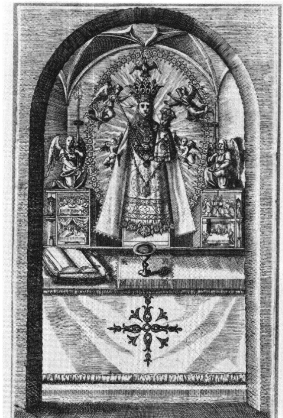
Abbildung 10: Altar in der Einsiedler Gnadenkapelle aus den «Annales Eremi» von 1610. Zentralbibliothek Zürich, Mappe Einsiedeln, I, 101, unten rechts.