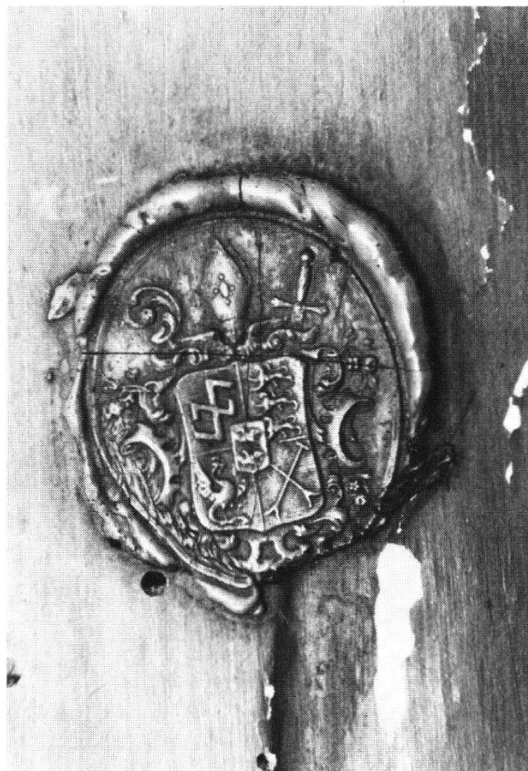
Abbildung 2: Wappen von Abt Beat Küttel (1780–1808), angebracht auf der Rückseite der Kopie des Einsiedler Gnadenbildes im Kloster Weesen, um 1805.