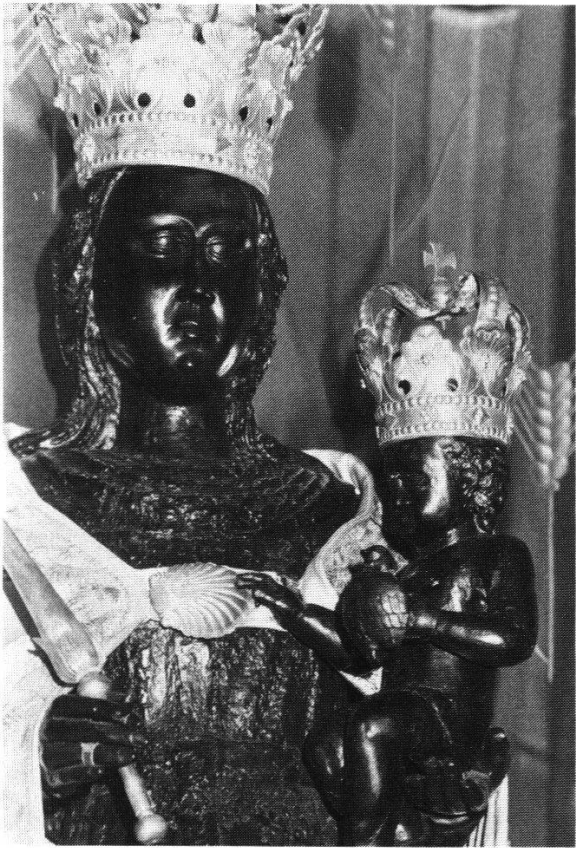
Abbildung 9: «Schwarze Muttergottes von Benrath» / Detail.