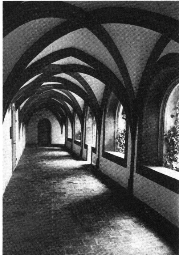
Abbildung 4: Kreuzgang im ehemaligen Dominikanerinnenkloster St. Katharina, St. Gallen.

St. Katharinen «die älteste bisher dokumentarisch nachgewiesene [Statue der Muttergottes von Einsiedeln] außerhalb ihres Verbreitungsgebietes». 14 Leider blieben diese Hinweise bisher in Einsiedeln unbeachtet.