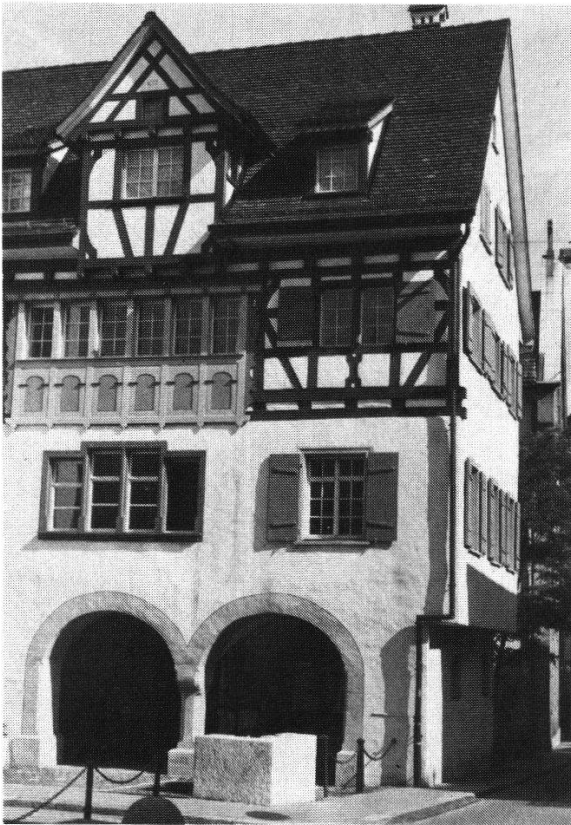
Abbildung 3: Ehemaliges Dominikanerinnenkloster St. Katharina, St. Gallen – Südtrakt.