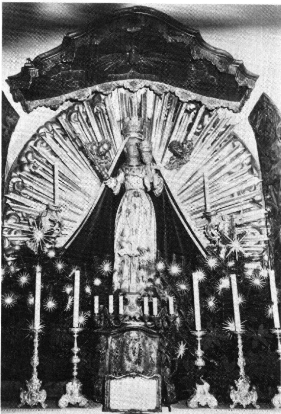
Abbildung 1: Einsiedler Gnadenbild in der «Einsiedler-Kapelle» zu Teising bei Neumarkt-St. Veith, geschaffen um 1624.