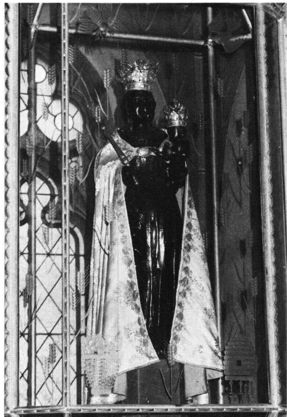
Abbildung 8: Kopie des Einsiedler Gnadenbildes in der Pfarrkirche St. Cäcilia, Düsseldorf-Benrath. Seit dem Brandanschlag im Jahre 1974 ist die «Schwarze Muttergottes von Benrath» durch ein Glasgehäuse geschützt.

bekleidet vermag uns auch die Kopie des Einsiedler Gnadenbildes in der Pfarrkirche St. Cäcilia in Düsseldorf-Benrath zu vermitteln. Hier ist der «Mantel» freilich nicht ein «rechteckiger Überwurf» sondern ein Pluviale oder Rauchmantel 44 (Abb. 8,9).