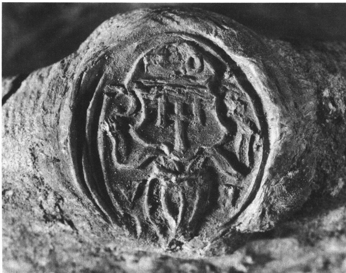
Abbildung 2 Siegel des Konstanzer Weihbischofs Balthasar Wurer auf dem Deckel des Reliquienglases.