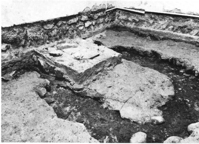
Abbildung 2: Der Chor gegen Südosten. Sichtbar sind neben dem ursprünglichen Mörtelboden ein jüngerer Altarstipes sowie die Substruktionen einer dazugehörigen Altarstufe.

der Kapelle in der Bausubstanz weitgehend erhalten hat. Lediglich die Westwand, deren Fundamente gefasst werden konnten, ist 1915 bei der Errichtung eines Westanbaus niedergelegt worden. Die Kapelle wies ursprünglich je einen Eingang im Westen der Nordwand und im Osten der Süd wand auf. Bekannt sind ferner zwei hochsitzende Rundbogenfenster auf der Südseite, die ebenfalls zum originalen Bestand gehören dürften. Baugeschichtliche Beobachtungen dazu fehlen jedoch.