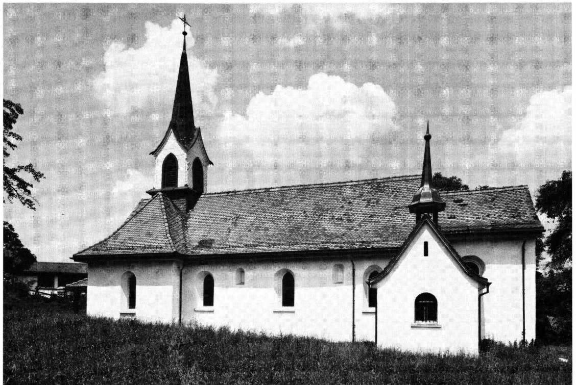
Abbildung 1: Die Kapelle St. Konrad und Ulrich von Süden

Die archäologischen Untersuchungen haben nun den Nachweis erbringen können, dass sich der Gründungsbau