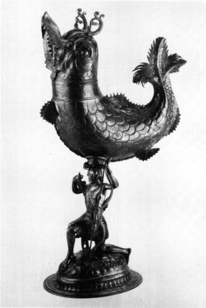
Abb. 3: Der Delphin von Arth.

den Namen und Wappen der dort eingeteilten Landleute, sondern mindestens teilweise um Silbergeschirr der dortigen Burgerschaften.