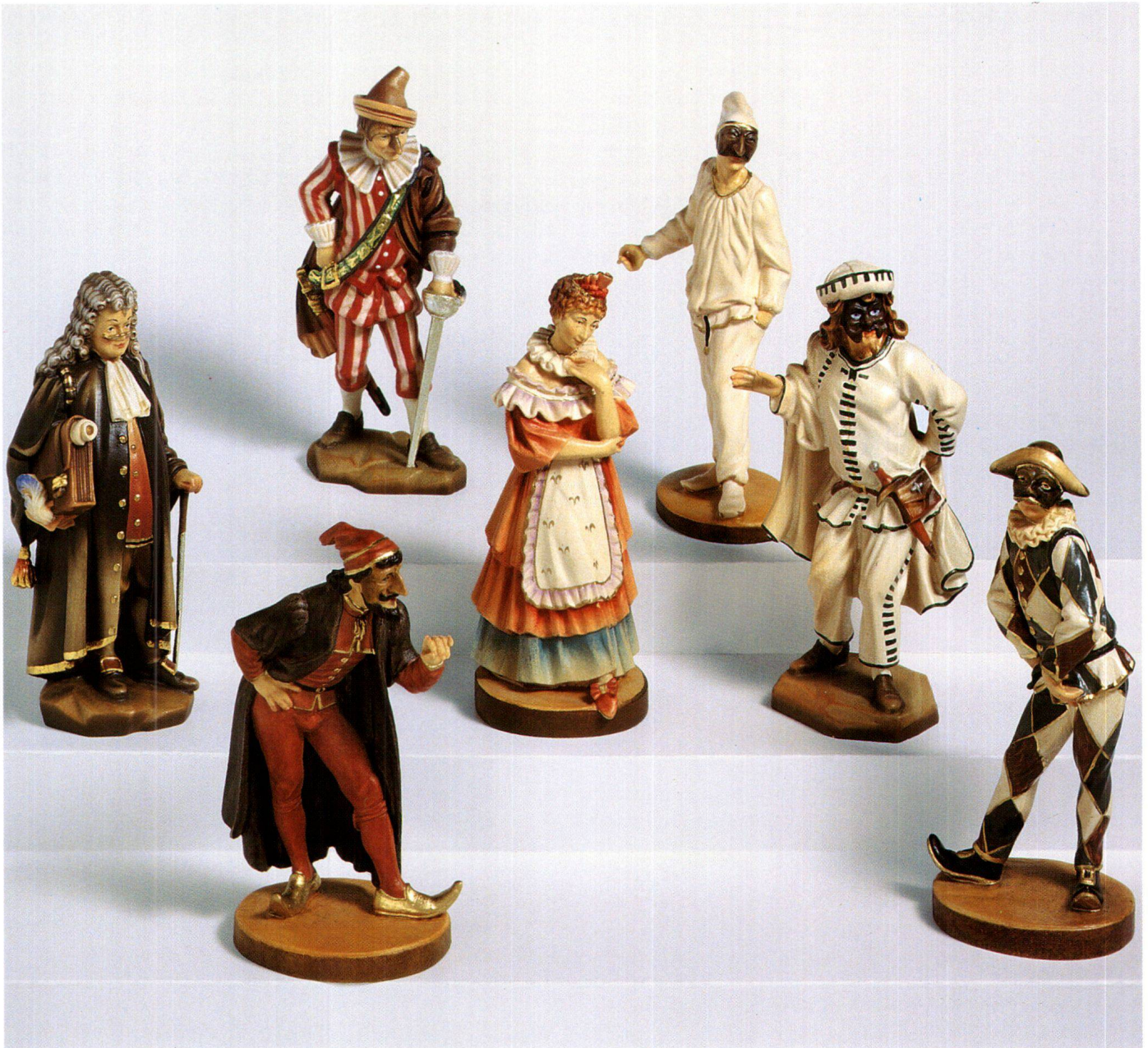
Abb. 2: Die in Holz geschnitzte und farbig gefasste Figurengruppe zeigt Komödianten aus der Commedia dell'arte, wie sie im Gedicht über den «Masquen Tanz» um 1800 in Schwyz auftritt. Es sind die drei Diener (links), die zwei Alten (rechts), Colombina (Mitte) und Giangurgolo (hinten). Die drei Diener oder Zanni-Figuren sind (von vorn nach hinten) Arlecchino (Varianten: Harlequin, Pierrot), Brighella (Variante: Hans Wurst). Die Alten verkörpern Pantalone und Jurist (Hauptfigur: Il Dottore). Im Zentrum steht Colombina, stellvertretend für die Bürgerin und Bäuerin im Gedicht. Aufschneider und Grossmaul Giangurgolo ist eine Variante von Scaramuz oder Il Capitano, der in der Commedia dell'arte als spanischer Offizier und Aussenseiter zum Bindeglied zwischen den Masken und den Amorososi wird. (Figurengruppe aus einer Bildhauerwerkstatt in St. Ulrich im Grödertal; 1997, Privatbesitz).