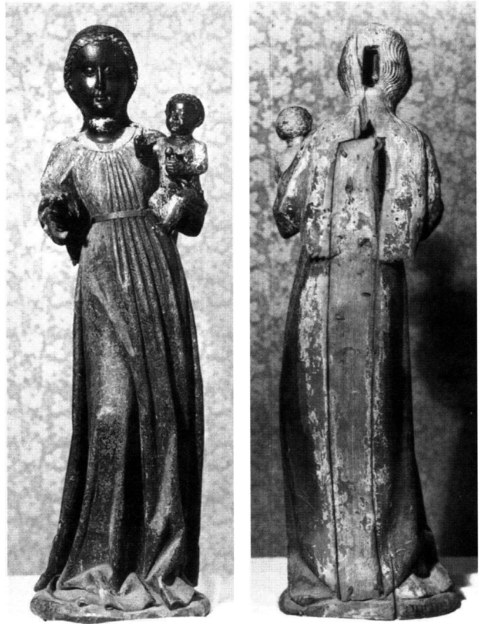
Abb. 5, 6: Schwarze Madonna von Einsiedeln, ohne Behang, vor der Restaurierung des Gnadenbildes 1933/1934. Aufnahme vom 16. September 1933. Die «langrechteckige Aushöhlung» im Hinterkopf des Gnadenbildes (Bild 6) diente möglicherweise der Aufnahme von «Heiltum».

1311 ist der Kreuzgang (oder Bittgang) der Schwyzer zu U. L. Frau von Einsiedeln erstmals urkundlich bezeugt. Dem Schwyzer Kreuzgang folgten andere Landeswallfahr-