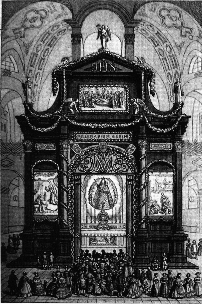
Abb. 7: Gnadencapelle im Jahre 1861. Stahlstich – Gebr. Benziger, Einsiedeln.