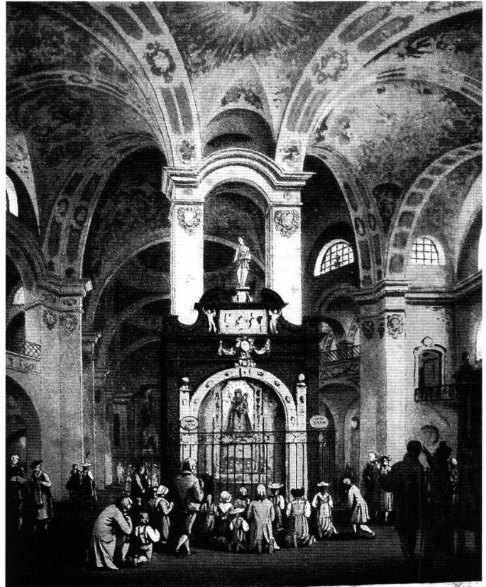
Das Innere der Kirche zu Maria Einsiedeln. L'intérieur de l'Eglise de Notre Dame des Hermites.

Ihre Fortsetzung erhielt die Festfeier am darauf folgenden Sonntag, dem Rosenkranz-Sonntag. Auf Anordnung der Herren von Schwyz fanden sich «aus jedem Bezirk des Kantons der erste Vorsteher ... zu besonderer Erbauung der unzähligen Volksmenge» ein. «Um 4 Uhr morgens wurde in der einst weilen auf vormaligem Plaze errichteten Kapelle mit deren Beleuchtung ein feyerliches Amt gesungen. Vor- und Nachmittag waren Predigten, die das Volk von dem Äusserlichen dieses Gepränges auf den wahren Geist und Zweck derselben hinwiesen. Nach 7 Uhr Abends war noch eine sehr feyerliche Prozession, wobey nicht nur die Fronte des Stiftes und des Dorfes, sondern auch von innen die ganze Kirche und Kapelle Tagheiter beleuchtet waren; nach welcher endlich der Musik-Chor durch das «Herr Gott, dich loben wir!» die ganze Feyerlichkeit einen erfreulichen Beschluss gab.» 156