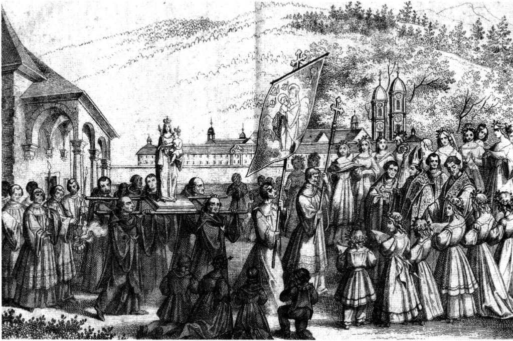
Abb. 5: Empfang des Gnadenbildes am 29. September 1803.