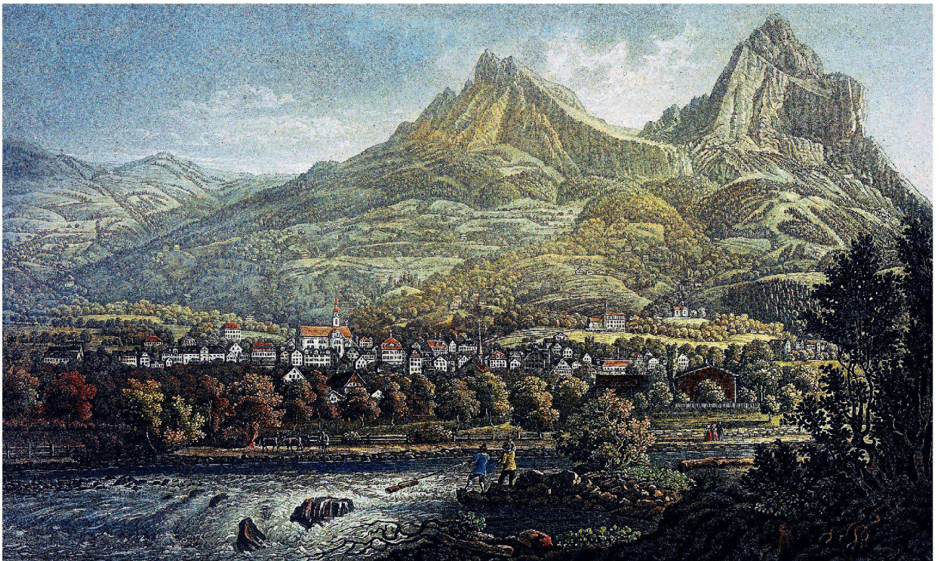
Ansicht von Schwyz mit der Muota aus Südwesten, kolorierte Aquatinta (um 1830/40) von Johann Baptist Isenring (1796–1860).