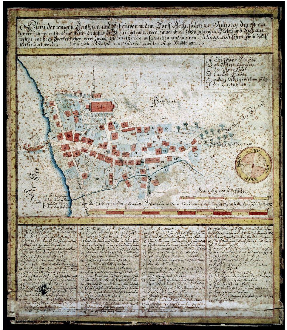
«Plan der ienigen Heüsseren und Gebäuwen in dem Dorff Arth, so den 21 ten July 1719 durch ein unversehens entstandene Feürs-Brunst in die Aschen gelegt worden, samet ihren darzu gehörigen Gärten und Hofstätten, welche aus hoch oberkeitlicher verordnung Geomethrice aufgemessen und in einen Jchnographischen Grund Riss verfertiget worden durch Jost Rudolph von Nideröst gewesten kay(serlichen) Hauptmann.»

Personen bezahlt werden musste, zugestanden. Ebenfalls auf drei Jahre begrenzt erhielten sie einen Anteil des Nutzens aus dem burgundischen Salzgeld. Beim Wiederaufbau wurde obrigkeitlich verordnet, dass die Bauten nicht mehr aus feuergefährlichem Holz, sondern in Stein errichtet wurden.