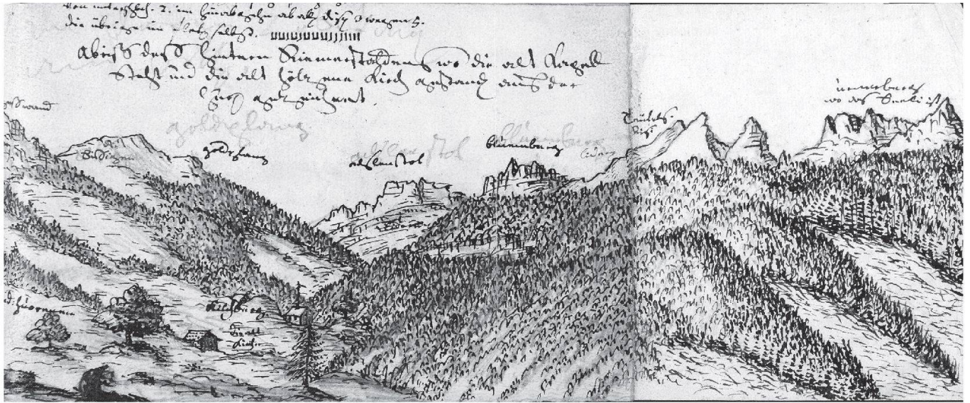
«Abriß des hinteren Riemenstaldens», Federzeichnung um 1800 von Thomas Fassbind.

legt, wenn jemand so arm wäre, dass er das Bussgeld nicht zahlen könnte, «dem sol dz gerichte vnd die lantlüte dz selbe lant verbieten da inne er seshaft ist oder gewonet hat, dz im da in dem selben lande nieman huse noch houe von essen noch trinken gebe noch helfe noch rate invent dem lande.» Auch wurde festgesetzt, dass Urner wie Schwyzer «ze beden siten ein ander behülffon vnd beraten sin du zeichen vf ze richten an allen stetten da si notdürftig sint dur da daz wir hie nach an stözze beliben.» Zur Vermeidung weiterer Grenzkonflikte sollten also die Grenzzeichen und Grenzmarken stetig erneuert werden.