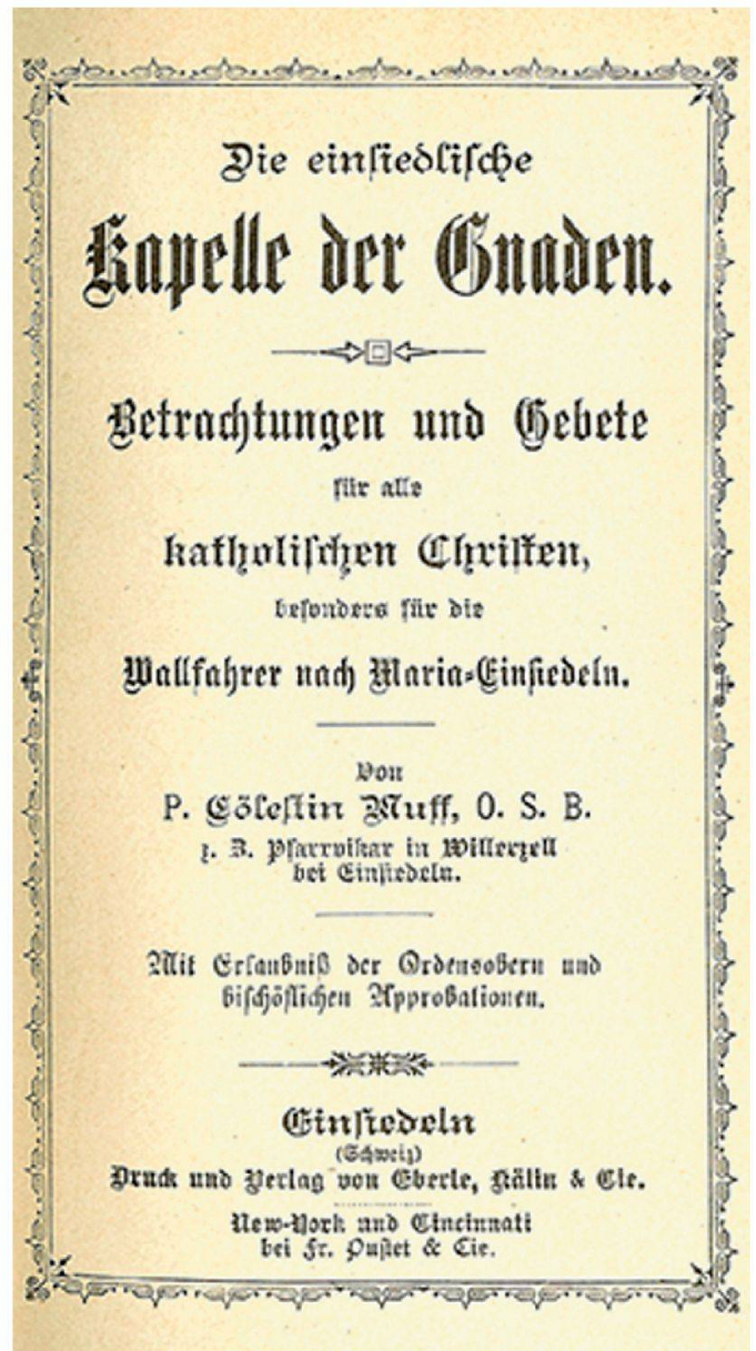
Frontispiz und Titelblatt des Andachtsbuches von Cölestin Muff «Die einsiedlische Kapelle der Gnaden. Betrachtungen und Gebete für alle Christen, besonders für die Wallfahrer nach Maria-Einsiedeln» im Verlag Eberle, Kälin & Cie. in Einsiedeln erschienen. Typisches Beispiel für einen der vielen Einsiedler Verlage und Druckereien im 19. Jahrhundert.