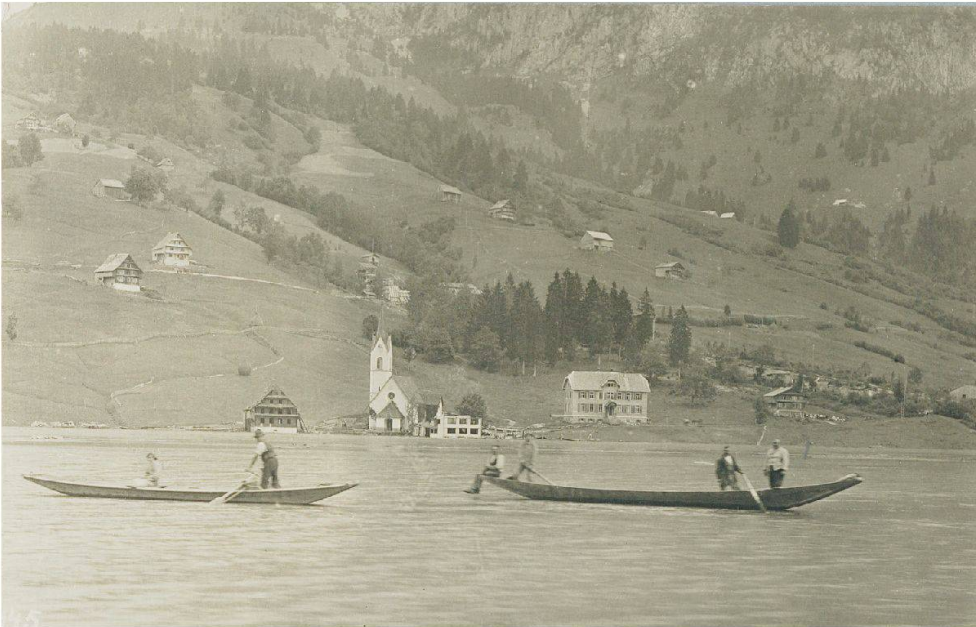
Abb. 16: Langsam steigt das Wasser – der aufgestaute See. Die alte Kirche Innerthal (im Hintergrund) wurde kurz nach dieser Aufnahme, am 9. August 1924, gesprengt.

Das Kraftwerk hatte von der Genossame Wägital und von den Landwirten die etwa 500 Hektaren Land, welche für den Stausee benötigt wurden, gekauft. Die meisten Grundstücke konnten sie freihändig erwerben, einige aber wurden expropriert. Die ursprüngliche Hoffnung der Bauern, dass ihr Land zu guten Preisen vergütet würde, hatte sich verflüchtigt. Bei einem Lokaltermin im Wägital mit dem Bezirksrat am 4. Oktober 1922, bei dem vor allem die Führung und der Ausbau der Strassen rund um den See diskutiert wurden, beklagte sich ein Vorderthaler Behördenvertreter: «Man habe im Wägital keine grossen Hoffnungen, dass der Boden etc. gut entschädigt werde; auf Grund der gemachten schlechten Erfahrungen könne niemand mehr Vertrauen haben.» Und der Wägitaler Pfarrer Karl Truttmann doppelte nach, dass die Bodenbesitzer nicht, wie immer behauptet, reichlich entschädigt würden; er beklagte die allgemein schlechte Behandlung der Bodenbesitzer durch das Werk. August Spiess versuchte zu vermitteln und erklärte, «dass der Bezirksrat und die Elektrizitätskommission die Interessen der Wägitaler, soweit möglich und gerecht, wahren werde.» 124