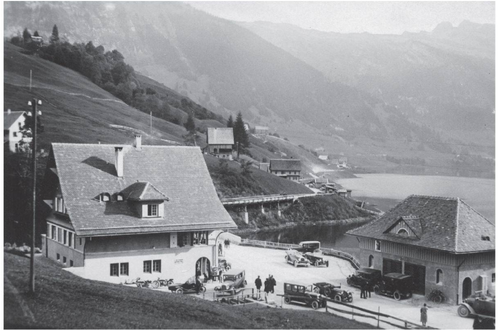
Abb. 17: Sonntagsverkehr in Innerthal beim Gasthaus Stausee, Mai 1930.