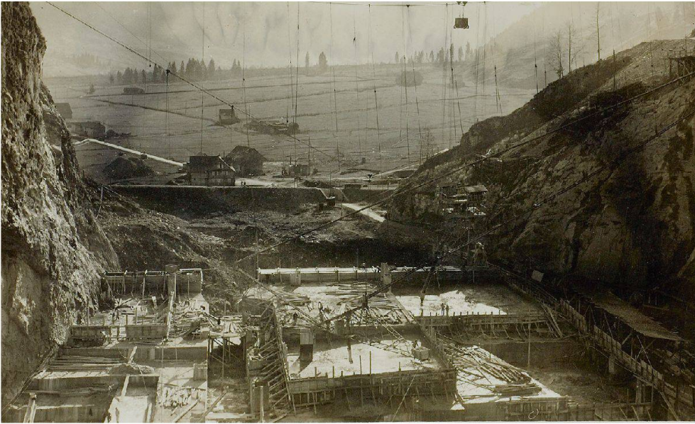
Abb. 14: Bau der Staumauer des Kraftwerks Wägital in der Schräh, um 1923/24. Im Hintergrund ist die zur Stauung vorgesehene Ebene von Innerthal zu sehen.