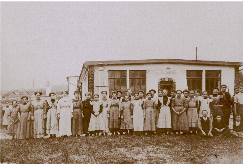
Abb. 10: Die weibliche Belegschaft der Fabrik am gleichen Tag.