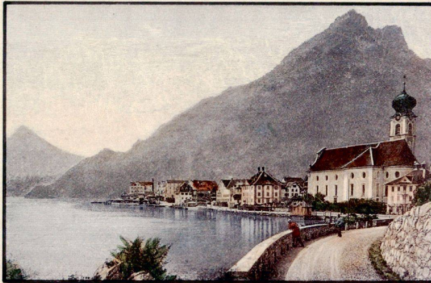
GERSAU AM VIERWALDSTÄTTER SEE — GERSAU SUR LE LAC DES QUATRE CANTONS

Abb. 3: Blick von der Strasse von Brunnen her auf Pfarrkirche und Dorf Gersau am Vierwaldstättersee um 1900, kolorierter Druck. Hermann Hesse beschrieb in seinem Tagebuch eine Ruderboots-Fahrt am 20. August 1901 von Vitznau nach Gersau und zurück. Unterwegs nahm er in der Gersauer Pension Rom ein Bad, verpflegte sich dort und plauderte mit dem Wirt, einem ehemaligen Schweizergardisten.