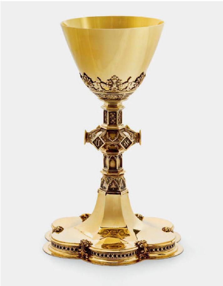
Abb. 8: In der Alpthaler Sakristei wird eine grosse Anzahl von gut erhaltenen liturgischen Geräten und Paramenten aus der Bauzeit der Kirche aufbewahrt. Einige Arbeiten im Stil des Historismus lieferte die 1885 von Adelrich Benziger (1833–1896) gegründete und 1907 aufgelöste «päpstliche Anstalt für kirchliche Kunst und Industrie» in Einsiedeln, so auch diesen neugotischen Kelch. Er war ein Geschenk von Karl Dominik Heinzer, Pfarrer in St. Gallenkappel, an die neu erbaute Kirche Alpthal.