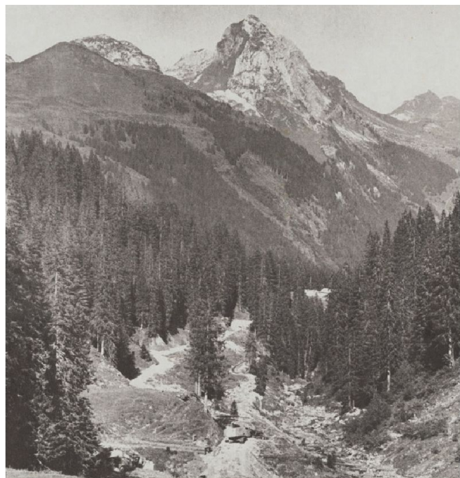
Abb. 4: Aufnahme beim Bau der Pragelstrasse durch das Militär beim Klöndurchlass, Richtung Glarner Grenze, zwischen 1970 und 1974. Die Militär-, Alp- und Forstwirtschaftsstrasse weist gegenüber allen früheren Projekten und dem Saumpfad eine neue Strecken-Führung auf, zum Beispiel auf der westlichen Pass-Seite vom Roggenloch her durch den Bödmerenwald, nicht direkt zum Pragelpass.