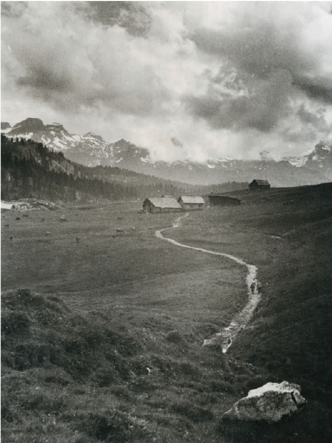
Abb. 3: Foto von der Pragelpasshöhe – Blick Richtung Muotathal (Südwesten), 1945. Die Aufnahme stammt vom Strasseninspektorat des Kantons Schwyz, das einen Bericht über ein Strassen-Projekt des Bezirksrates Schwyz von 1939/1940 erstellte, welches – wie schon viele zuvor und ein paar danach – nicht über das Planungs-Stadium hinaus gelangen sollte.

volkswirtschaftlichen Auswirkungen des Baus der Klausenstrasse und die militärische Bedeutung der Axenstrasse herangezogen. 23