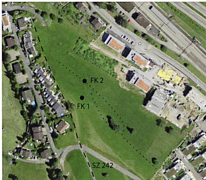
Abb. 2: Die Flur Ribitschi mit ehemaligem Saumweg gemäss Bundesinventar der historischen Verkehrswege der Schweiz (IVS), Strecke SZ 242 (gestrichelt), und Wegspuren in der abschüssigen Wiese (gepunktet) sowie den Fundorten der römischen Münzen, Fundkomplex (FK) 1 (Katalog (Kat.) 1) und FK 2 (Kat. 2), Abbildung genordet.