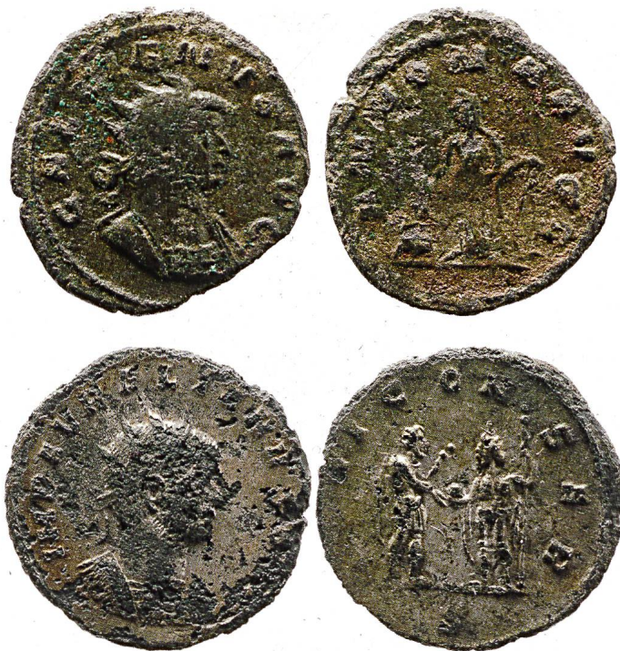
Abb. 4: Zwei römische Münzen: Gallienus, Antoninian 262 nach Christus (oben) und Aurelianus, Aurelian (Pseudo-Antoninian) 272 nach Christus (Kat. 1–2; Massstab 2:1).

Die Gesamtmünzreihe beginnt mit zwei so genannten Antoninianen der zweiten Hälfte des 3. Jahrhunderts nach Christus (Kat. 1–2; Abb. 4). Diese Periode war politisch eine sehr unruhige Zeit, was sich auch auf die Wirtschaft und damit auf die Münzprägung auswirkte. Die Antoniniane – vom Wert her eigentlich doppelte Denare – enthielten in dieser Zeit nur noch wenig Silber (unter 10%). Beide Fundstücke ähneln sich grundsätzlich, sie sind offizielle Prägungen von technisch hoher Qualität und mit weitgehend