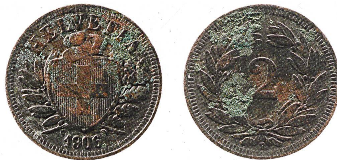
Abb. 7: Schweiz, Eidgenossenschaft, 2 Rappen 1906. Prägung mit gezeichneten Stempeln: Teile des Münzbildes der Gegenseite sind in den glatten Stellen des Feldes erkennbar (Kat. 17; Massstab 2:1).

Das 2-Rappen-Stück von 1906 (Kat. 17; Abb. 7) zeigt auf den zweiten Blick eine interessante Besonderheit: Es wurde mit so genannten «gezeichneten Stempeln» hergestellt! Wenn beim Prägevorgang die Stempel zusammengeschlagen werden, ohne dass ein Münzrohling, ein so genannter Schrötling, dazwischen liegt, können sich die Stempel gegenseitig «beprägen»: Die so entstandenen Verletzungen bleiben im Stempel und werden auf alle Münzen