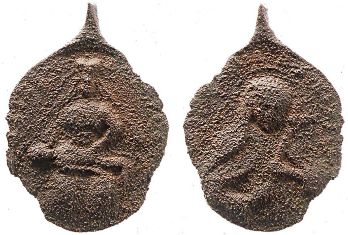
Abb. 9: Reute bei Bad Waldsee (Baden-Württemberg), Medaille auf die Wallfahrt zur «Guten Beth», zweite Hälfte 18. Jahrhundert (Kat. 33; Massstab 2:1).

Vorgang ist für einige Plombentypen belegt –, oder sie landeten im Abfall.