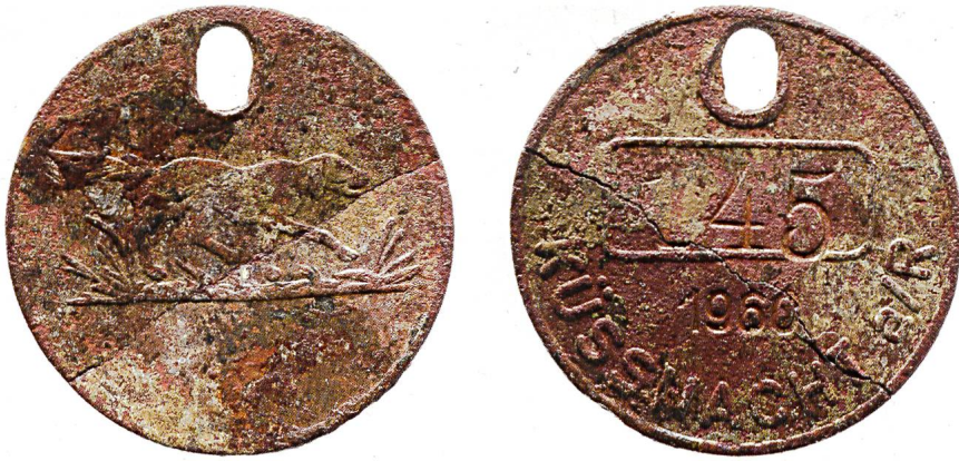
Abb. 8: Küssnacht am Rigi, Hundemarke 1960 (Kat. 29; Massstab 2:1).

dies vom Bund toleriert: So sah man zum Beispiel noch im Jahr 1895 weder Handhabe noch Anlass, gegen das in Genf zirkulierende französische Kupfergeld vorzugehen, solange die amtlichen Kassen dessen Annahme strikt verweigerten und die Bevölkerung solches Geld im grenznahen Verkehr auch wieder ausgeben konnte. Im Bericht des Bundesrats wird zudem hervorgehoben, dass zu diesem Zeitpunkt ausreichend eidgenössische Kleinmünzen in Genf vorhanden wären. 21 Erst im Jahr 1900 wurde auf eine Anfrage des Kantons St. Gallen hin die Zirkulation deutscher Münzen in der Nordostschweiz genauer untersucht, samt einer Zusammenstellung der bisherigen Regelungen. 22 Es zeigte sich, «dass die an gewissen Orten zu Tage tretenden Übelstände nicht etwa nur Fremden (Touristen, Händlern, Kaufleuten), sondern vielfach unserer Bevölkerung selbst zuzuschreiben seien, die, um sich ja kein Geschäft entgehen zu lassen, allzu bereitwillig fremdes Geld an Zahlungsstatt annehme, und dann wieder ausgeben.» Die Bundesbehörden hofften auf ein Umdenken der Bevölkerung, wenn dieses fremde Geld nicht mehr abgesetzt werden konnte; dieser parallele Geldumlauf war zwar nicht zu verhindern, aber doch soweit möglich zu reduzieren.