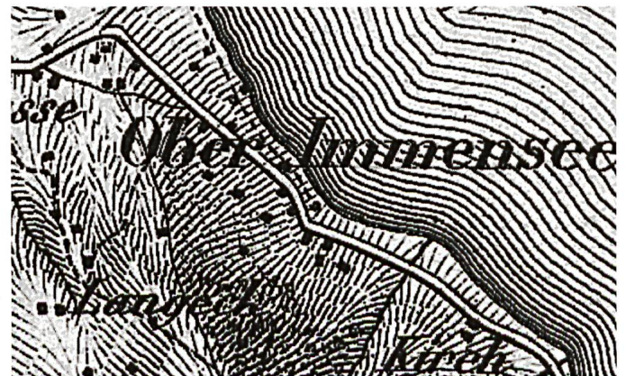
Abb. 3: Ausschnitt «Ribitschi» aus der genordeten Dufourkarte von 1861. Der Saumpfad nach dem heutigen Inventar (IVS SZ 242) verläuft von Südsüdost (SSE) nach Nordnordwest (NNW) durch den Buchstaben «O» von Ober Immensee.