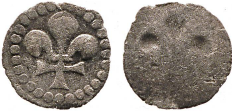
Abb. 5: Strassburg, Stadt, Pfennig 16. Jahrhundert (Kat. 8; Massstab 2:1).