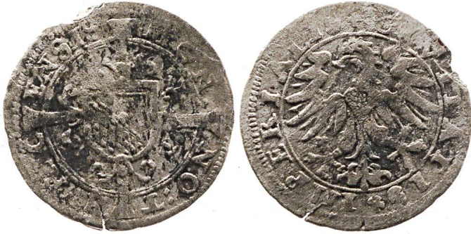
Abb. 6: Zürich, Stadt, Schilling um 1620–1622 (Kat. 6; Massstab 2:1).