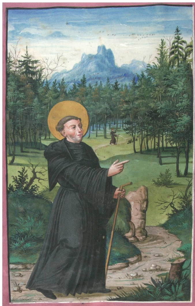
Abb. 3: Für ein gottgeweihtes Leben in Einsamkeit entschied sich auch der hl. Meinrad (um 797–861). Um die Mitte des 9. Jahrhunderts verliess er das Kloster Reichenau, um «im finsternen Wald» – einer hiesigen Form der Einöde – zu leben. Am Ort seiner Klause und Ermordung entstand das Kloster Einsiedeln.