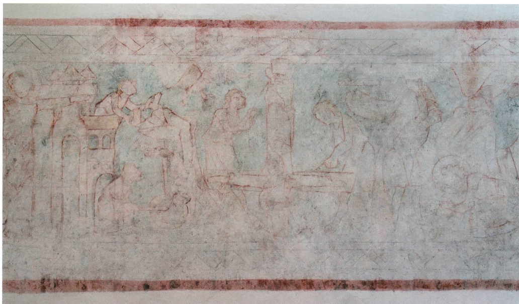
Abb. 1: Apostelfries in Kirche St. Peter und Paul auf der Ufnau, vermutlich zweite Hälfte 12. Jahrhundert.

Die Apostel als Weggefährten von Christus wurden schon im frühen Christentum als Vermittler zwischen Gott und den Menschen verehrt. Gleiches galt für Märtyrer, also Menschen, die um des christlichen Bekenntnisses willen den Tod auf sich genommen hatten. 2 Ihrer wurde seit der Mitte des 2. Jahrhunderts feierlich gedacht, indem sich die Gemeinde am Jahrestag der Hinrichtung an ihren Gräbern versammelte und sie um die Fürbitte bei Gott anhielt. 3 Die im römischen Reich zunächst lokalen und im 3. und bis zu Beginn des 4. Jahrhunderts im ganzen Reichsgebiet auftretenden Christenverfolgungen brachten für die überlebenden Christen viele heilige Vorbilder hervor. 4 Seit dem 4. und 5. Jahrhundert