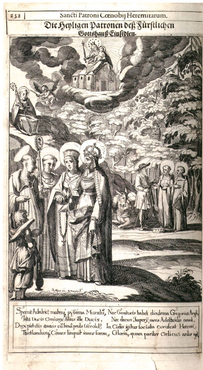
Abb. 4: Darstellung mit Adelsheiligen des Klosters Einsiedeln aus dem Jahr 1648. Im Vordergrund stehen beieinander (von links): Adalrich, Gregor mit Abtstab, Herzogin Reginlinde und Kaiserin Adelheid. Darüber sitzt der sel. Thietland mit Abtstab und Buch; er war der zweite Abt von Einsiedeln. Die Personengruppe im Hintergrund bilden (von links): Herzog Gerold mit seinen Söhnen Kuno und Ulrich. Gemäss der Legende handelt es sich bei Gerold um den Herzog von Sachsen, der sich für ein Leben als Eremit entschied, seine Klausel in der Einöde des Walgaus und Frientals zu einem kleinen Kloster ausbaute und es dem Kloster Einsiedeln vor seinem Tod schenkte. Seine Verehrung als Heiliger setzte in Einsiedeln im 17. Jahrhundert ein.