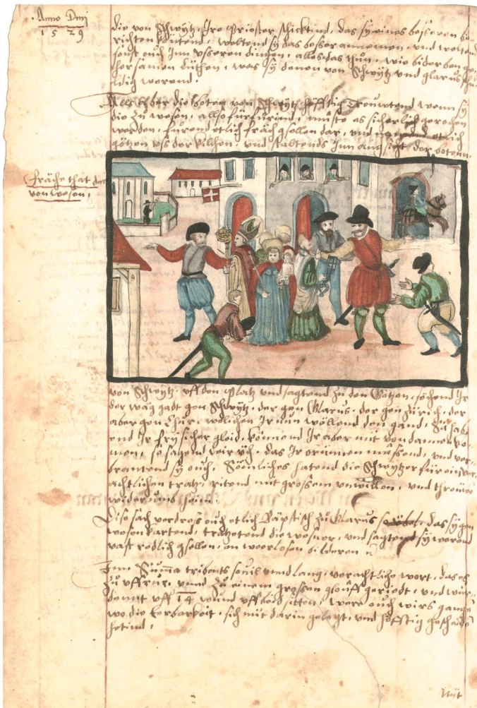
Abb. 6: Bilderstürmer verhöhnen die Heiligenstatuen in Weesen.