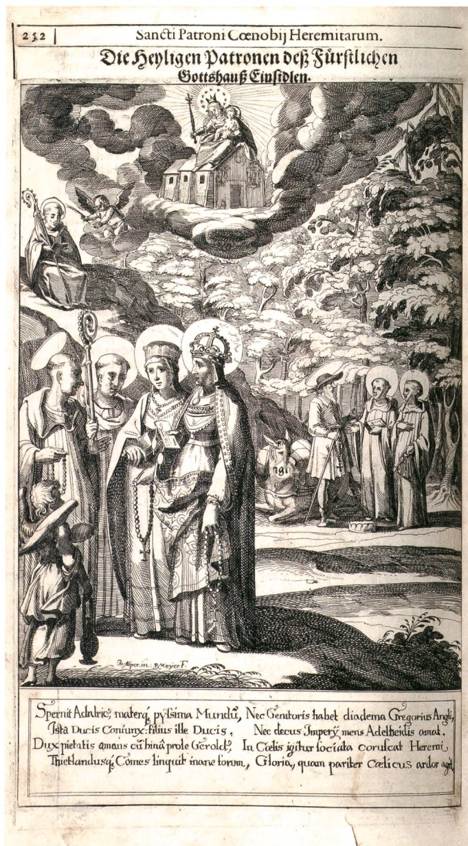
Abb. 4: Darstellung mit Adelsheiligen des Klosters Einsiedeln aus dem Jahr 1648. Im Vordergrund stehen beieinander (von links): Adalrich, Gregor mit Abtstab, Herzogin Reginlinde und Kaiserin Adelheid. Darüber sitzt der sel. Thietland mit Abtstab und Buch; er war der zweite Abt von Einsiedeln. Die Personengruppe im Hintergrund bilden (von links): Herzog Gerold mit seinen Söhnen Kuno und Ulrich. Gemäss der Legende handelt es sich bei Gerold um den Herzog von Sachsen, der sich für ein Leben als Eremit entschied, seine Klausel in der Einöde des Walgaus und Frientals zu einem kleinen Kloster ausbaute und es dem Kloster Einsiedeln vor seinem Tod schenkte. Seine Verehrung als Heiliger setzte in Einsiedeln im 17. Jahrhundert ein.