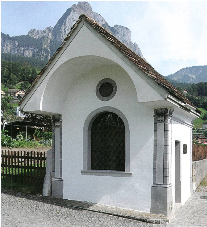
Abb. 7: Die kleine Kapelle am alten Weg von Schwyz über die Haggenegg nach Einsiedeln soll an der Stelle gebaut worden sein, wo Kardinal Karl Borromäus auf seiner Visitationsreise den Flecken Schwyz gesegnet haben soll.

den werden». 46 Mit der Durchsetzung der Beschlüsse des Trienter Konzils in der Eidgenossenschaft betraut war Kardinal Karl Borromäus (1538–1584), der bereits 1610 heiliggesprochen wurde. Seine 1570 unternommenen Hirtenbesuche in den katholischen Orten erlaubten es ihm, sich ein eigenes Bild von den kläglichen kirchlichen Zuständen in der Eidgenossenschaft zu machen und die Grundlagen für tiefgreifende Neuerungen zu legen. 47 Allerdings schienen «Anspruch und Wirklichkeit» dennoch weiterhin auseinanderzuklaffen. 48