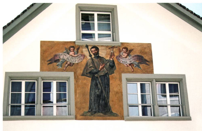
Abb. 9: Haus Hauptplatz 6 (ehemals «Haus Rickenbach») in Schwyz. Engel halten Spruchbänder mit der Inschrift «S. Franc. Xaverius S.I. Ind. Apost. // S. Missionis domus et patriae patronus.»