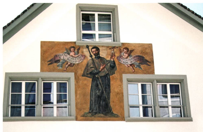
Abb. 9: Haus Hauptplatz 6 (ehemals «Haus Rickenbach») in Schwyz. Engel halten Spruchbänder mit der Inschrift «S. Franc. Xaverius S.I. Ind. Apost. // S. Missionis domus et patriae patronus.»