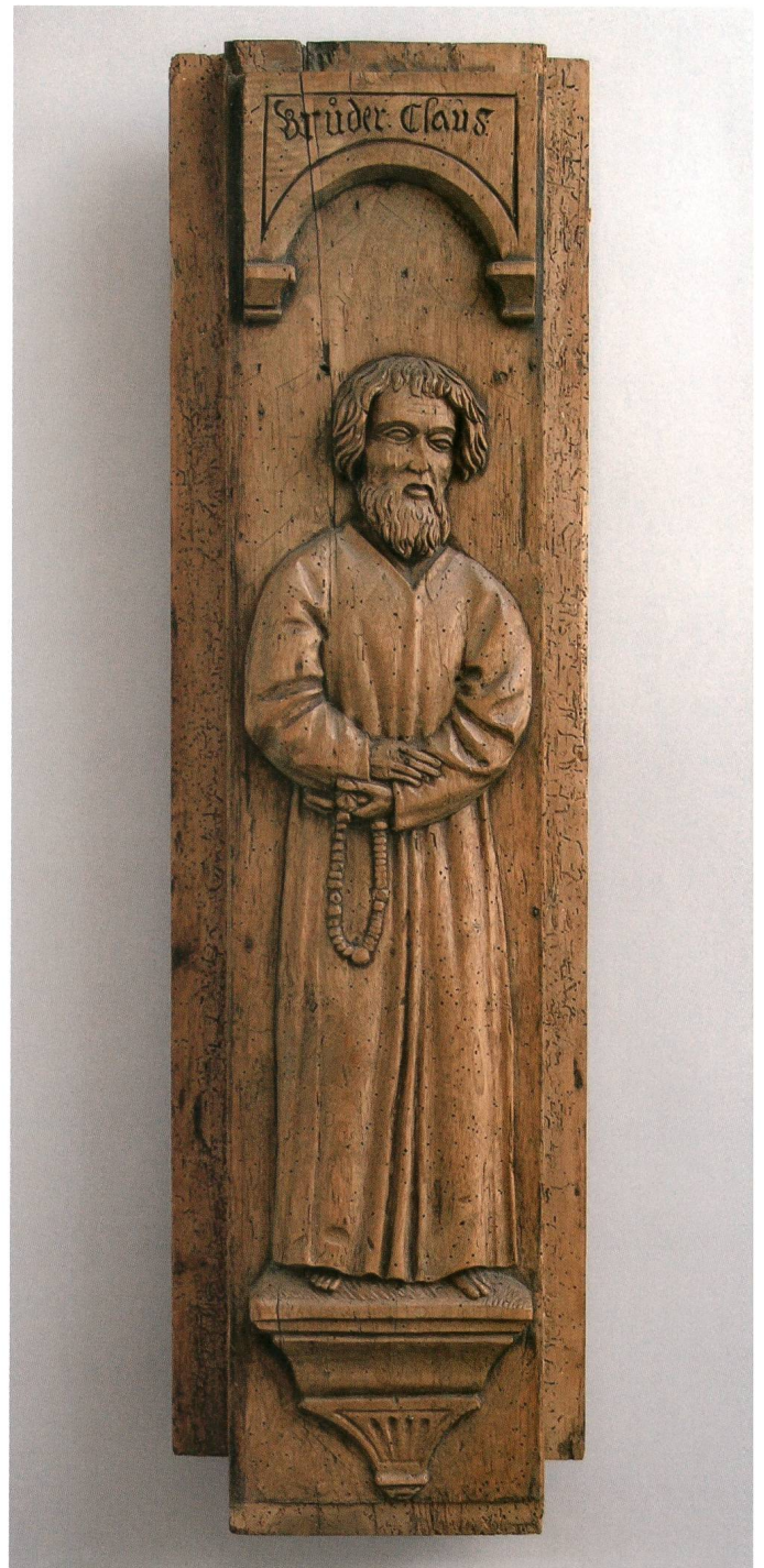
Abb. 5: Darstellung von Niklaus von Flüe (1417–1487) auf einem vermutlich um 1570 geschaffenen Schwyzer Fensterpfosten aus dem Haus Laschmatt.

Trotz Kritik beispielsweise von Thomas von Aquin, der betonte, dass die Heilsgewissheit nicht an materiellen Überresten eines Heiligen hänge, war für die Frömmigkeitspraxis diese Form der unmittelbaren Anwesenheit eines Heiligen von zentraler Bedeutung. Die Reliquien wurden als Vergegenwärtigung himmlischer Heilskraft den Gläubigen in der Kirche präsentiert. 43