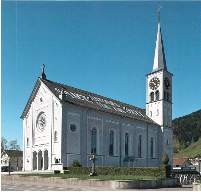
Abb. 2: Die Pfarrkirche von Rothenthurm ist dem hl. Antonius geweiht. Um 356 verstorben, gilt der ägyptische Eremit als Repräsentant des asketischen Einzeldaseins. Der hl. Antonius ist auch der Patron der Pfarrkirche von Ibach.

wurden über bekannten Märtyrergräbern Basiliken errichtet, beispielsweise in Rom über den Gräbern von Petrus und Paulus. Zudem erfolgten erste Überführungen von Reliquien aus den Gräbern, die in der Antike grundsätzlich ausserhalb der Stadtmauern lagen, in innerstädtische Kirchen. 5 Nach dem Ende der Christenverfolgungen und dem Mailänder Toleranzedikt, das Kaiser Konstantin (262–337) im Jahr 313 erliess und das die christliche Religion anderen Religionen gleichstellte, wurden die Märtyrer seltener.