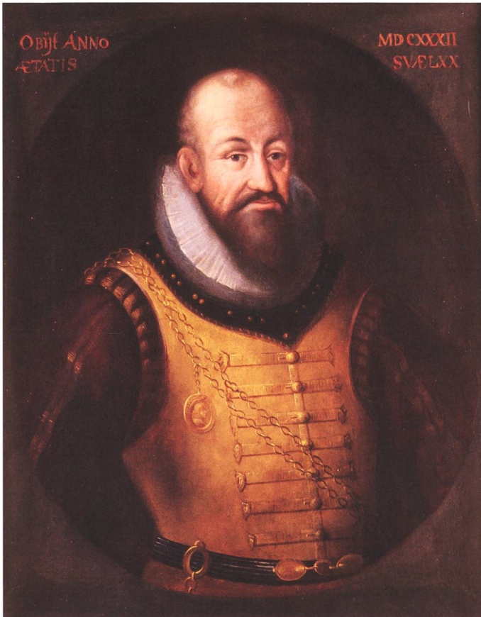
Abb. 3: Porträt des Gilg Frischherz (†1631), Schwyzer Landammann in den Jahren 1620–1622, 1624–1626 und 1630–1631. Frischherz war während der Pestepidemie von 1628/1629 immer wieder in speziellen Kommissionen tätig, um Massnahmen zur Bekämpfung der Seuche zu ergreifen.

Einsiedeln eine während der Pestepidemie von 1611 erlassene «Ansehung und Ordnung bey gegenwärtigem Sterbend auff Gefallen / vnd Verbesserung meines gnädigen Fürsten / vnd Herrn abgeredt / vnd beschlossen den 11. Julij, Anno 1611». 75 Dass es verschriftlichte Pestordnungen auch für das Land Schwyz gegeben haben muss, geht aus verschiedenen Quellen hervor. 76 Das sehr ausgeprägte Milizprinzip in der Vormoderne stellt im Kanton Schwyz eine keineswegs einfache Situation für die archivische Überlieferung dar. 77