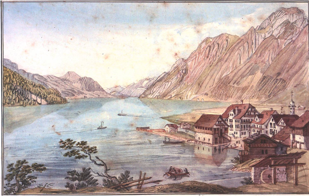
Abb. 2: Ansicht des Hafens von Brunnen um 1800. Brunnen am Vierwaldstättersee lag an der verkehrsmässig wichtigen Nord-Südverbindung über den Gotthard. Der Ort war deshalb in Seuchenzeiten besonders exponiert und damit ein mögliches Einfallstor für eine Seuchenausbreitung im Land Schwyz. In Zeiten der Pest wurden die Kontrollen hier massiv verschärft.

Eine solche Vorstellung ist noch im heutigen Sprachgebrauch der Krankheit Malaria bekannt. Zum anderen stand die so genannte Kontagionstheorie teilweise in Konkurrenz zur Miasmatheorie, wobei die Kontagionslehre auf der Erfahrung der hohen Ansteckbarkeit der Pest basierte. Obwohl in der Vormoderne der Übertragungsweg durch Mikroorganismen unbekannt war, ging man von der Vorstellung aus, dass das «Pestgift» direkt von Mensch zu Mensch oder über kontaminierte Waren übertragen werden konnte. Durch die Isolation von Pesterkrankten und durch die Überwachung des Personen- und Warenverkehrs aus pestverseuchten Regionen sollte die Seuche eingedämmt werden. 45