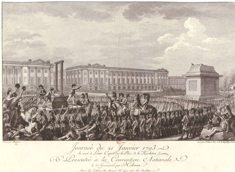
Abb. 2: Isidore-Stanislas Helman (1743–1806/1810) hält auf einem Kupferstich die Hinrichtung König Ludwigs XVI. am 21. Januar 1793 fest. Diese Tat war für die Einsiedler Mönche ein Beweis für den gottlosen Charakter der Revolution.

an verurteilte man nämlich die Umkehrung der – wie dargestellt – als von Gott eingerichtet verstandenen Ordnung aufs Schärfste, wobei es für Abt Beat im Frühling 1790 eine kaum zu glaubende menschliche Überheblichkeit darstellte, dass die höchste Macht in Frankreich nun nicht mehr in den Händen König Ludwigs XVI. (1754–1793), sondern bei einer selbsternannten Volksvertretung liegen soll. 8 Vollends aus allen Wolken fiel man hier, als man von der am 21. Januar 1793 erfolgten Hinrichtung des Monarchen erfuhr, die für die Einsiedler den endgültigen Beweis für den gottlosen Charakter der Revolution bildete. 9