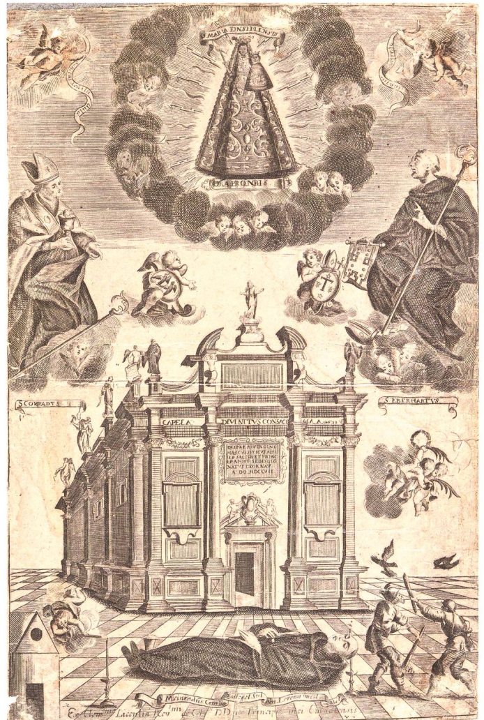
Abb. 1: Seit dem Mittelalter war die Einsiedler Gnadenkapelle mit dem darin gezeigten Gnadenbild das Ziel von Wallfahrern aus ganz Europa: Es handelt sich um eine Radierung des Einsiedler Künstlers Franz Xaver Schönbächler (geboren 1719) aus der Mitte des 18. Jahrhunderts, die vor der Kapelle den im Jahre 861 von zwei Räubern erschlagenen heiligen Meinrad zeigt.

Von entscheidender Bedeutung für das Selbstverständnis der Mönche war die – wohl im 12./13. Jahrhundert entstandene – so genannte «Engelweihlegende», wonach Christus selbst am 14. September 948 die erwähnte Gnadenkapelle in Begleitung unzähliger Engel und Heiliger zu Ehren seiner Mutter Maria geweiht haben soll. 3 Die Historizität dieses Geschehens war im ausgehenden 18. Jahrhundert sowohl im Einsiedler Konvent als auch beim Gros der