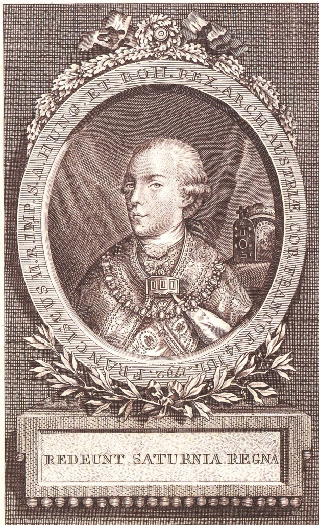
Abb. 4: Dieser zeitgenössische Kupferstich zeigt Kaiser Franz II. im Krönungsornat. Das Kloster Einsiedeln unterstützte den Kaiser respektive den Erzherzog im Kampf gegen die Revolution mit Krediten in der Höhe von insgesamt 200 000 Gulden, die aber vor Frankreich geheim zu halten waren.