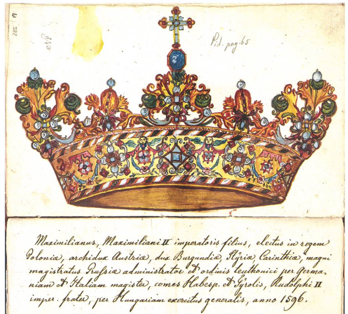
Abb. 6: Frühzeitig aus Einsiedeln geflüchtet wurde unter anderem die so genannte «Polenkrone», die einst Erzherzog Maximilian III. (1558–1618) dem Kloster geschenkt hatte; hier gezeichnet von Pater Eustach Tonassini (1744–1826).