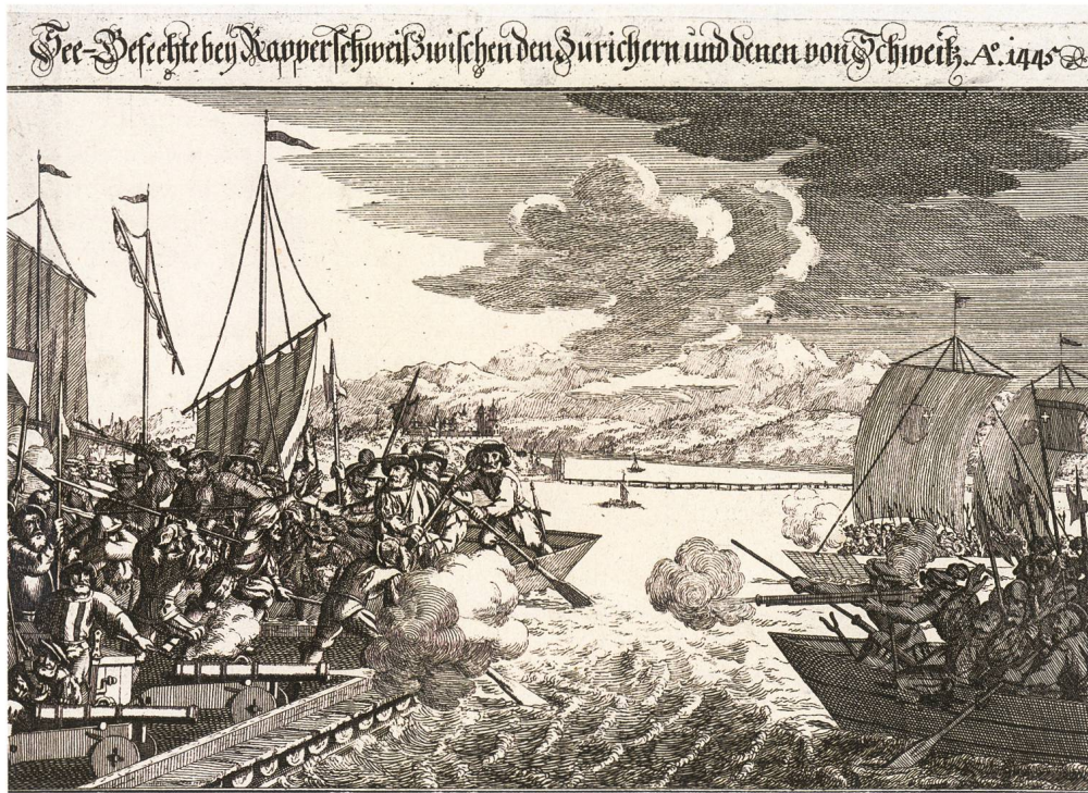
Abb. 4: «See-Gefechte bey Rapperschweil zwischen den Zürichern und denen von Schweitz, Ao. 1445», Füssli Johann Rudolf (1709–1793), hg. von Gesellschaft der Constaffleren und Feuerwerker (Zürich), in: Neujahrsblatt der Constaffler und Feuerwerker im Zeughaus, 1744.

gen bar sin, desglichen ob ein gast den andren erstäche, sol ôch bar gen bar sin.» 44 Der im Bussenrodel 1484 erwähnte dritte Fall – ein Hofmann erschlägt einen Fremden – wird gleicherweise geahndet, wie wenn ein Hofmann das Opfer wäre. 45 Vierzig Jahre später vollzog der Bussenrodel von 1524 eine konstitutive Korrektur und eine präzisierende Ergänzung: Zum einen wird nicht mehr zwischen einem Hofmann und einem Fremden unterschieden («Jtem wenne ouch, da gott vor sye, jeman den andern zu todt erschlüg oder libloß tätte, so soll der todtschlag dem frömden unnd dem heimischen, einem alls dem andern, sin [...].») 46 Zum andern unterscheidet der Rodel neu zwischen einem ehrlichen und