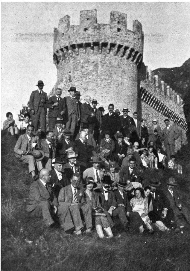
Eine Gruppe von Teilnehmern vor dem Schloss Schwyz in Bellinzona.