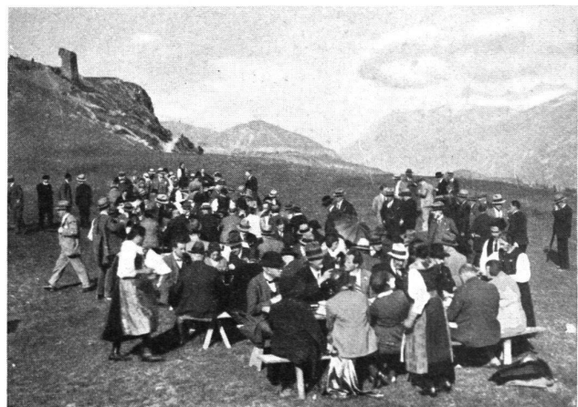
„Räclette“ bei den Ruinen von Seta.

Sonntag morgen fuhr man mit der Bahn nach Sitten, wo man sofort zur Valeria hinanstieg. Diese berühmte, kleine Kathedrale im Burgbezirk ist vom Kantonsarchäologen Morand vortrefflich restauriert und so diskret zu einem Museum eingerichtet worden, dass sie auch jetzt noch gelegentlich als Kirche dienen kann. Monseigneur Biéler, der Bischof von Sitten, hatte die grosse Freundlichkeit, für die Burgenfreunde eigens ein Pontifikalamt zu feiern. Es war höchst eindrucksvoll, durch die