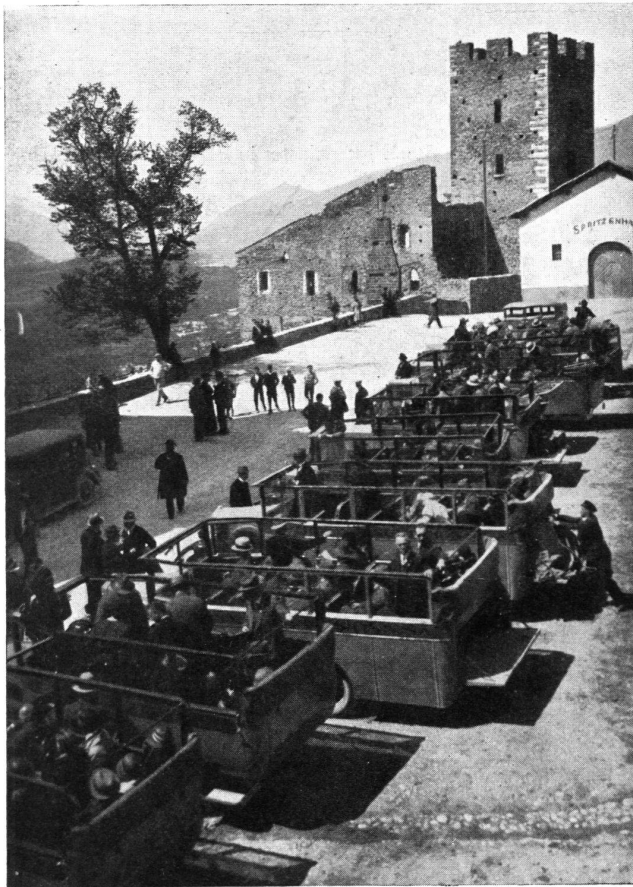
Vor der Abfahrt in Leuk. Im Hintergrund die Ruinen des ehem. bischöfl. Schlosses.