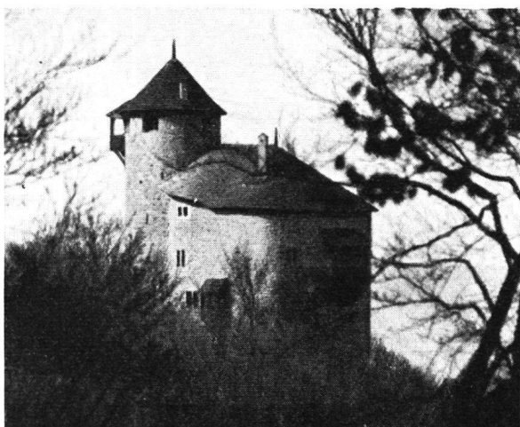
Reichenstein , wiederhergestellt, von Nordosten

In einer der letzten Nummern der „Nachrichten“ teilten wir mit, dass diese seit dem Ende des 15. Jahrhunderts nur noch als Ruine erhaltene Burg samt dem prächtigen Buchenwald von einem Basler erworben wurde, der sie nach einem Projekt des Architekten Eugen Probst und unter dessen Leitung in seiner äussern Form wiederherstellen liess. Die nebenstehenden Bilder zeigen die Burg, welche eine