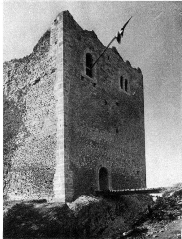
Abb. 3 nach der Restaurierung