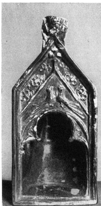
Abb. 4 Glasierte gotische Ofenkachel (Aufsatz) gefunden bei den Aus- grabungen der mittleren Ruine Wartenberg

der ehemalige hochgelegene Zugang zur Burg nach den vorhandenen Resten wiederhergestellt worden, ebenso ein hübsches romantisches Doppelfenster, von dem Teile bei den vorgenommenen Ausgrabungen gefunden wurden, die sich restlos ergänzen ließen (Abb. 6). Auch wertvolle keramische Bruchstücke und Funde von baulicher Bedeutung aus romanischer und gotischer Zeit sind durch die Ausgrabungen zutage gefördert worden. Gemäß einem Abkommen, das der Schweizerische Burgenverein mit der Schweizerischen Gesellschaft für Vogelkunde und Vogelschutz schon vor einigen Jahren abgeschlossen hat, sind auch bei der Ruine Wartenberg Nistgelegenheiten für besonders geschützte Vögel (Turmfalken, Mäusebussarde, Uhu) angelegt worden.