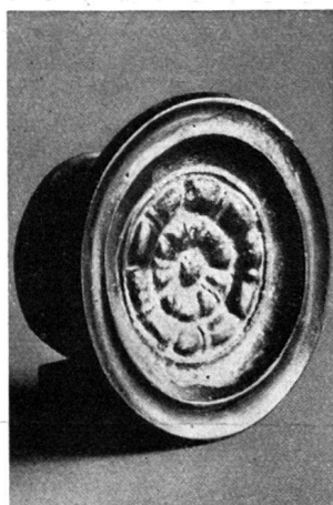
Abb. 5 Glasierte Ofenkachel gefunden bei den Ausgrabungen der mittleren Ruine Wartenberg