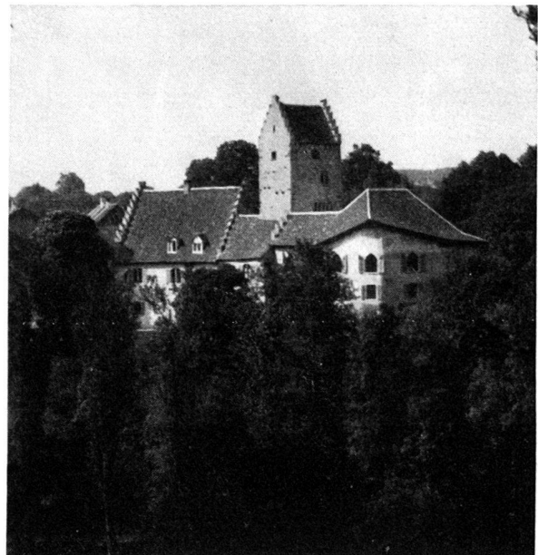
Das vor Jahresfrist z. T. abgebrannte, nun wieder hergestellte Schloß Liebenfels bei Mammern. Vgl. „Nachrichten“ Jahrgang 1933, Nr. 5 (Seite 23)

Bei der kürzlich abgehaltenen Jahresversammlung der Gesellschaft für die Erhaltung des Schlosses Chillon ist mitgeteilt worden, daß zufolge neuester Forschungen die frühere, nunmehr fallengelassene Bezeichnung gewisser Räume als „Gerichtssaal“, „Rittersaal“, „Kammer der zum Tode Verurteilten“, „Ewige Gefängnisse“ usw. der Phantasie eines Schloßwarts des 19. Jahrhunderts entstammen und keineswegs der geschichtlichen Wahrheit entsprechen.