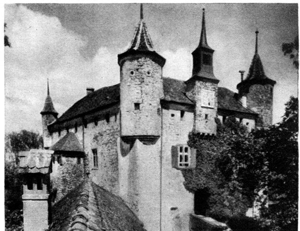
Château d'Oron. Les Tourelles

L'avenue actuelle par où l'on accède au manoir passe au pied du donjon, longe la face orientale pour aboutir à la poterne flanquée d'une tourelle, dont le dernier aménagement