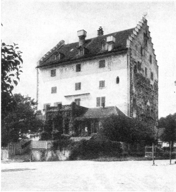
Greifensee im heutigen Zustand