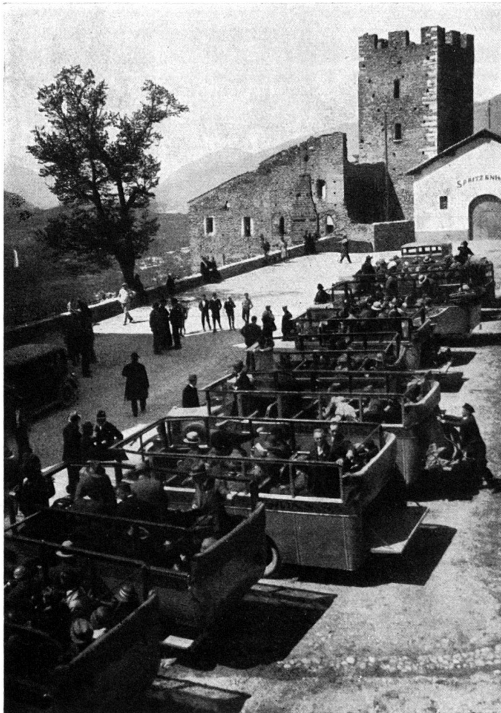
Links : Burgenfahrt im Wallis im Mai 1931. Der Wagenpark vor dem ehemaligen bishöflichen Schloß Leuk. An der Fahrt, die drei Tage dauerte, nahmen über 200 Personen teil