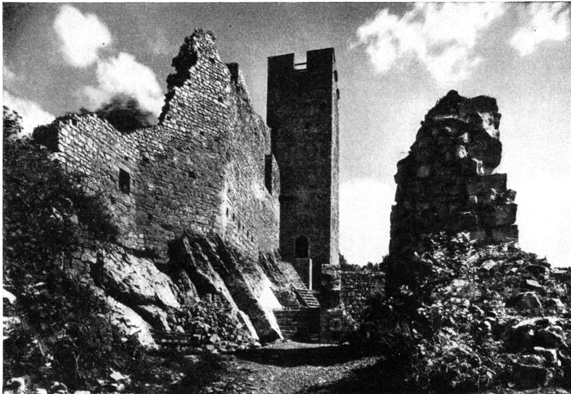
Waldenburg nach der Instandstellung

Außer den vorstehend genannten Objekten hat sich der Burgenverein noch mit folgenden Burgen und Schlössern befaßt (Gutachten über vorzunehmende Restaurierungen, Anregungen über Erhaltungsarbeiten, Kostenvoranschläge usw.).