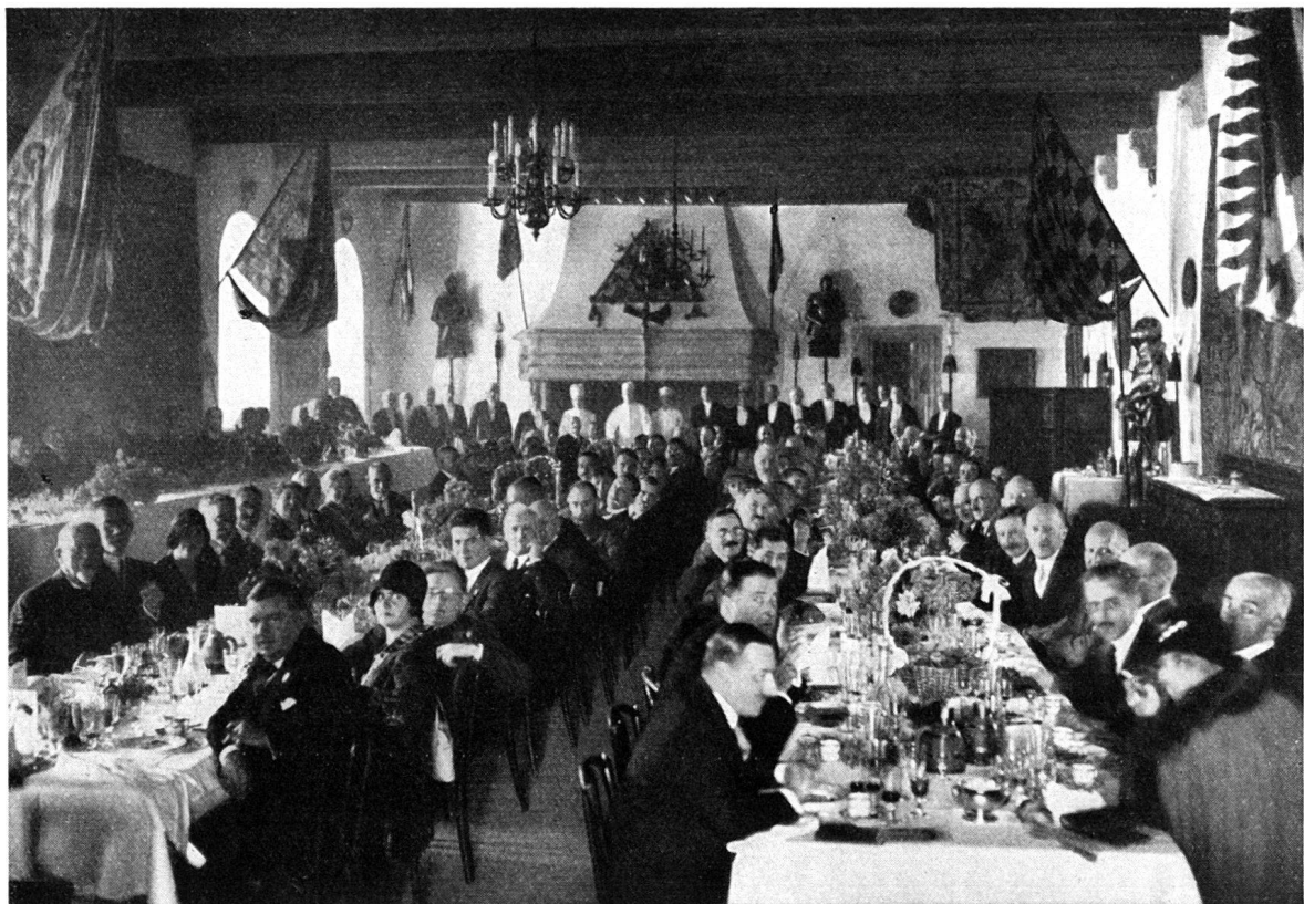
Burgenfahrt in die Waadt, Oktober 1928. Großes Festdiner, das der Besitzer des Schlosses Champvent , Chevalier de Stüers, den Teilnehmern an der Fahrt im großen Rittersaale gespendet hat