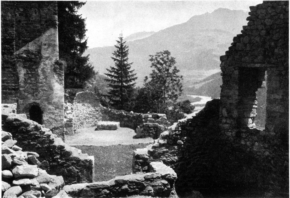
Jörgenberg (Graubünden). Blick ins aufgedeckte Kircheninnere mit dem Altarrest. Links der Campanile. Ausgrabungen und Renovation 1929/30