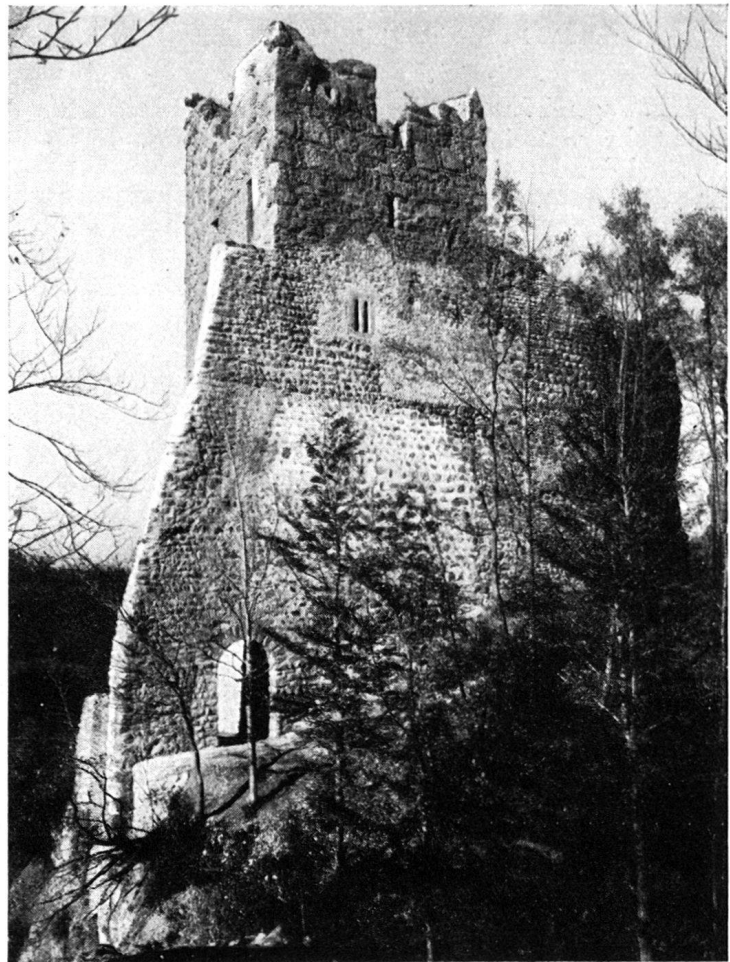
Ramschwag (St. Gallen) 1929/31 renoviert