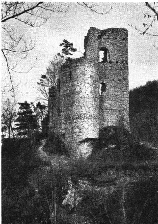
Die Ruine Rotberg 1934

Diese Jugendburgen, wie sie in Deutschland, Österreich und Frankreich entstanden sind und neuerdings auch in Italien geschaffen werden, dienen der wandernden Jugend in den Ferien als heimelige Zwischenstation, wo sie gegen geringe Vergütung ein- oder mehrtägig sich aufhalten kann.