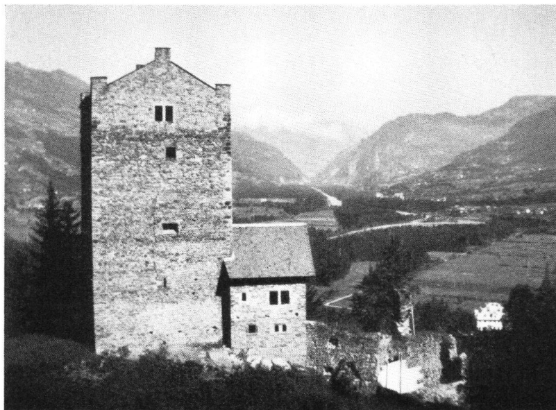
Ehrenfels im Sommer 1938