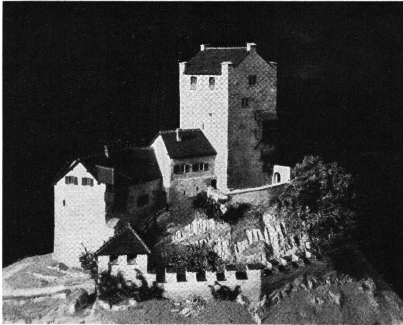
Ehrenfels, wie die fertige Jugendburg aussehen wird (die Ringmauer unten mit den Zinnen ist noch erhalten). Nach einem Modell.

So bitten wir auch Sie um eine Gabe, damit wir die Burg Ehrenfels für die Jugend ausbauen und ihr ein neues romantisches Wanderziel schaffen können. Wir danken im voraus bestens für jede freundliche Spende.