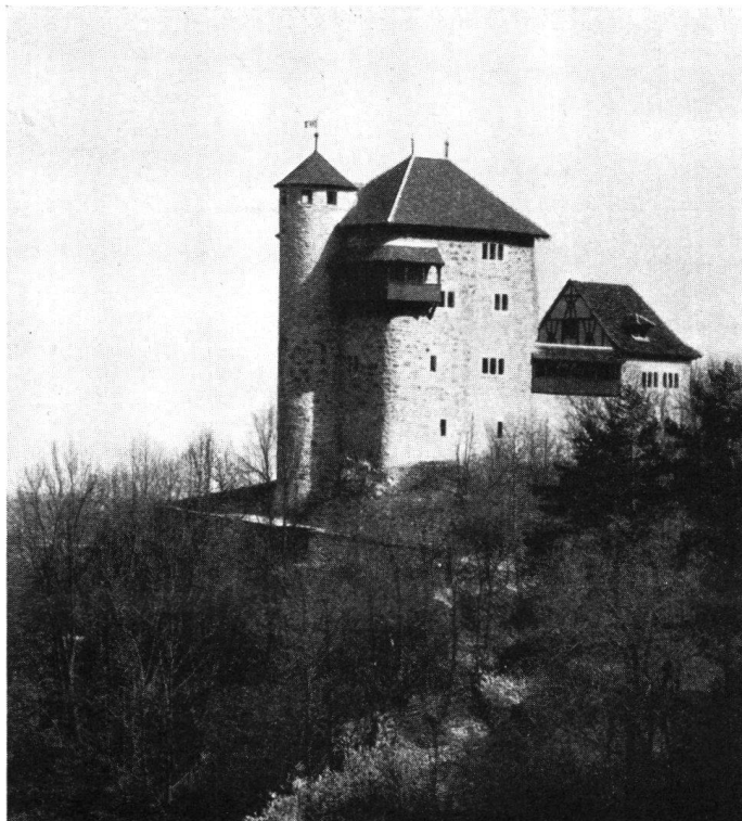
Die Jugendburg Rotberg 1936

Die erste Jugendburg in der Schweiz bei Mariastein im Kanton Solothurn wurde vor zwei Jahren dem Betrieb übergeben und war in jeder Hinsicht ein voller Erfolg . Der Burgenverein hat eine große Anzahl Anerkennungen dafür erhalten.