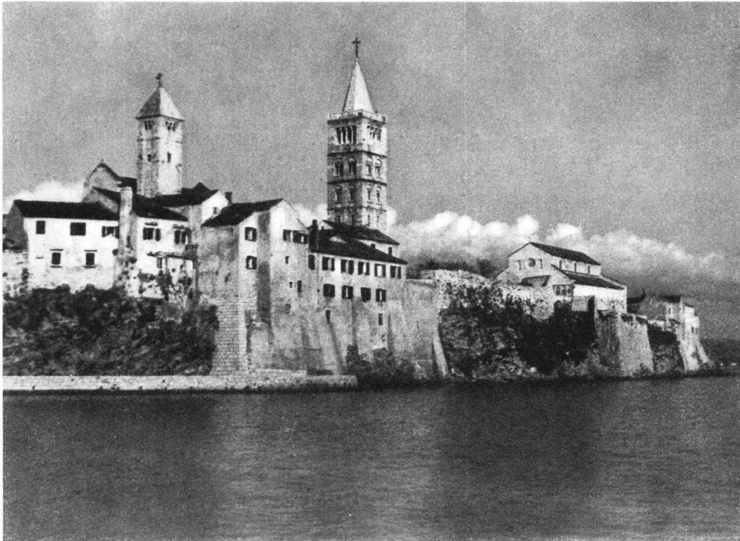
Rab, das überaus malerische Städtchen, das zuerst besucht wird