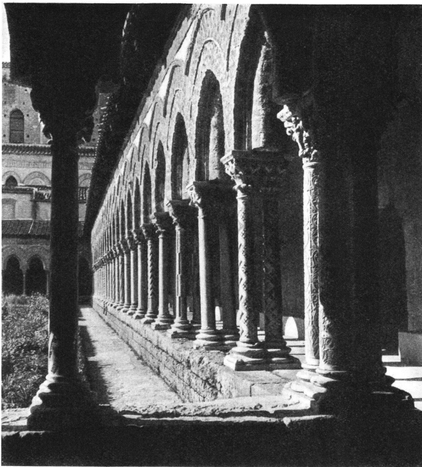
Kreuzgang im Kapuzinerkloster in Dubrovnik

Am zweiten Abend wird auf dem Schiff ein Lichtbilder-Vortrag über Dalmatiens Kunst und Kultur geboten.