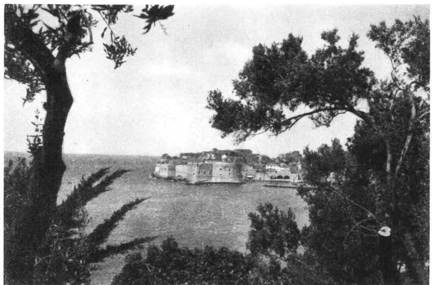
Blick auf Dubrovnik mit der Burg

Änderungen des Reiseprogramms bleiben vorbehalten.