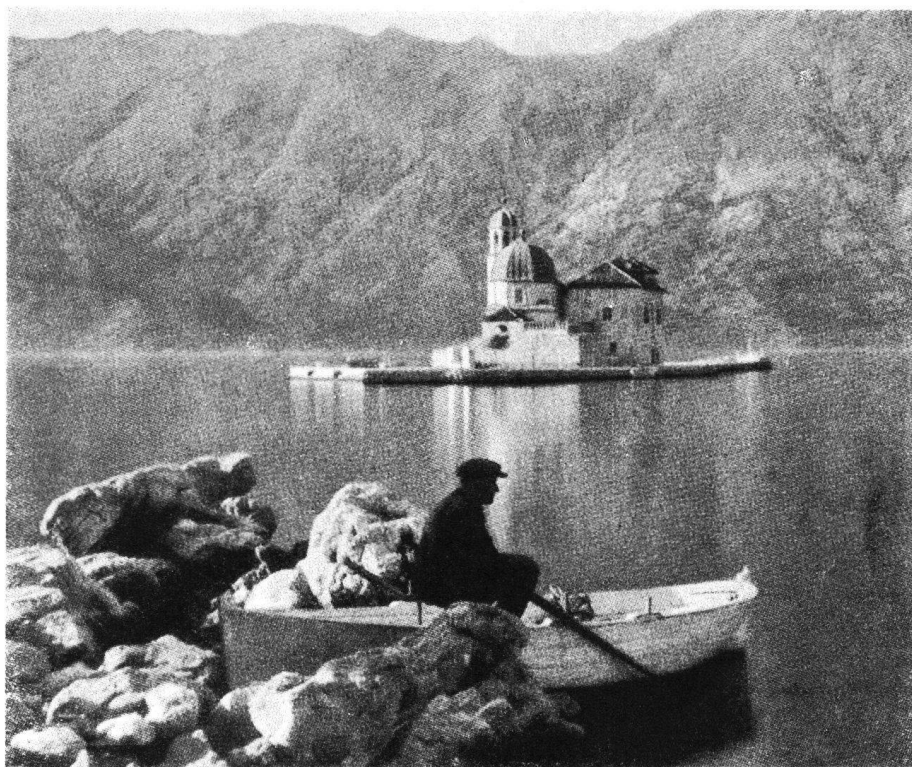
Die Insel Gospa mit dem berühmten Kloster in der Bucht von Kotor, welches wir besuchen werden