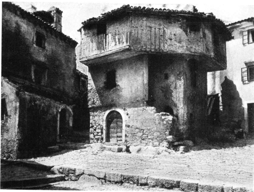
Alte Türkenwohnung bei Kotor

20. März mitzuteilen. Nach diesem Termin können Anmeldungen nicht mehr entgegengenommen werden.