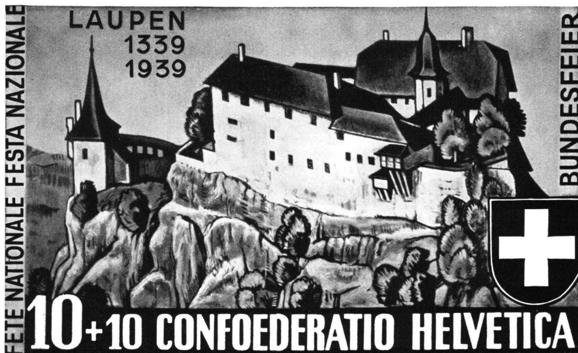
Original der Bundesfeiermarke 1939