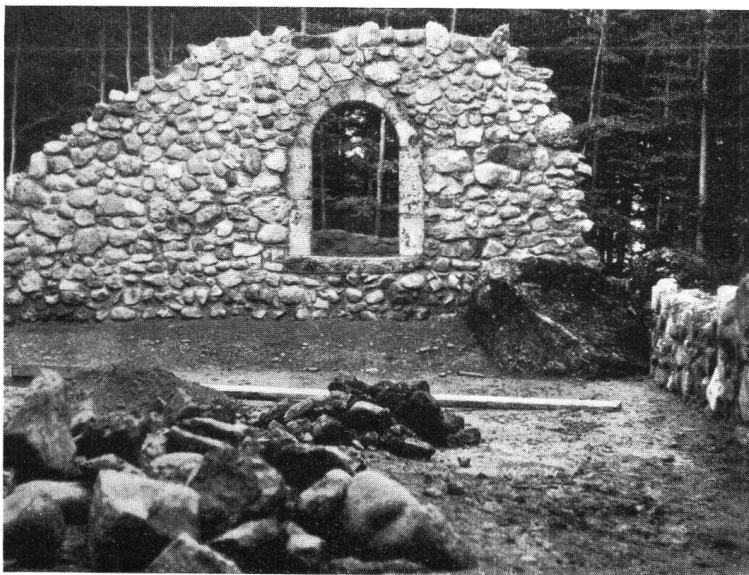
Ruine Bernegg. Partie mit der ausgegrabenen und wiederhergestellten Tür zwischen A und B (s. Plan)

Vor einigen Jahren schon hat die Antiquarische Gesellschaft Zürich Untersuchungen der Burgstelle vorgenommen. Eine systematische Ausgrabung erfolgte aber erst in den letzten Jahren, als es möglich wurde, mit Hilfe von Arbeitskrediten und mit Unterstützung der Arba-Lotterie eine Anzahl Arbeitsloser zu beschäftigen, die dann auch unter Aufsicht und Leitung des Burgenvereins und