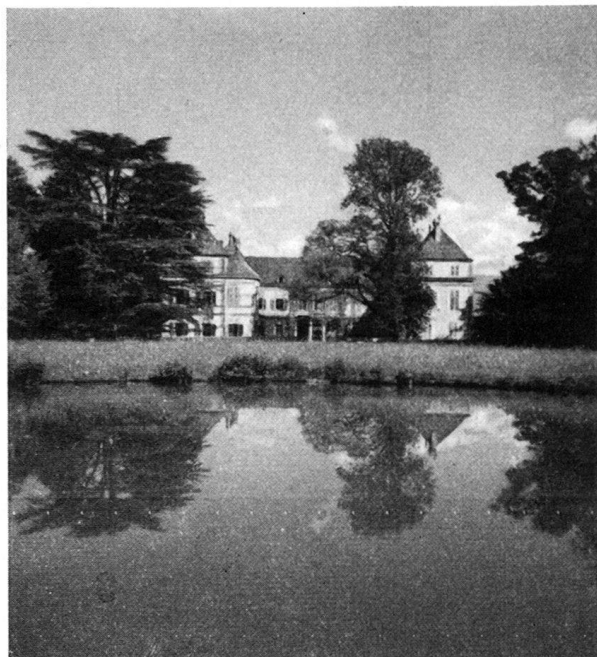
Der prächtige Landsitz der Familie Micheli

Der letzte Tag endlich galt noch Nyon und seiner waadtländischen Umgebung: dem großartigen Bau des Schlosses Crans (1764) und dem nicht minder großen Eindruck erweckenden des Schlosses Prangins (1748), dessen Besichtigung ausnahmsweise gestattet war. In Nyon selbst stand der Besuch der mittelalter-