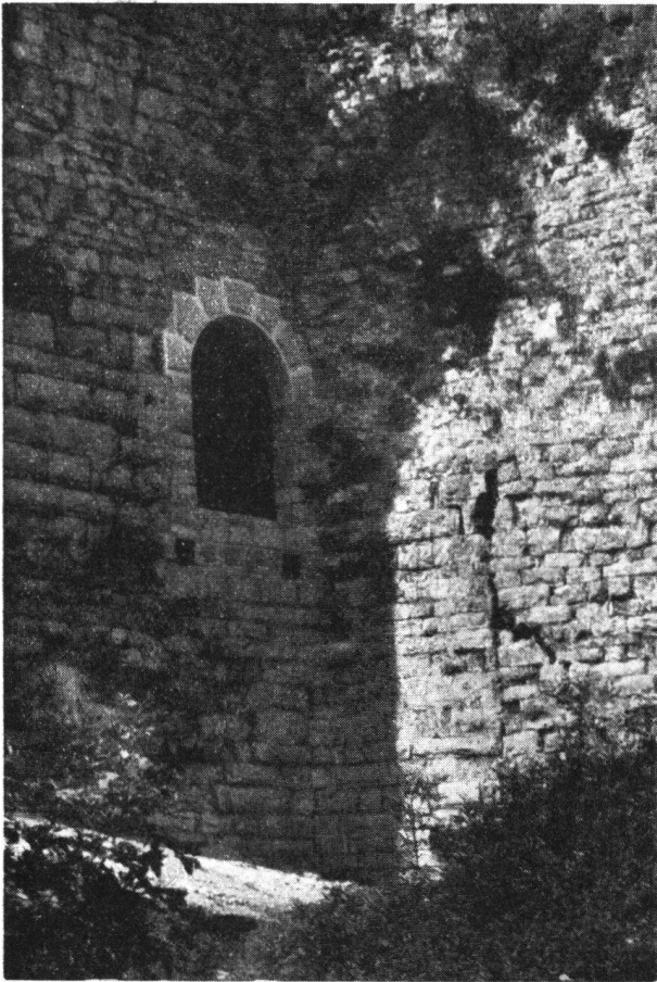
Vorderer Wartenberg, der wiederhergestellte ursprüngliche Eingang zum Bergfried