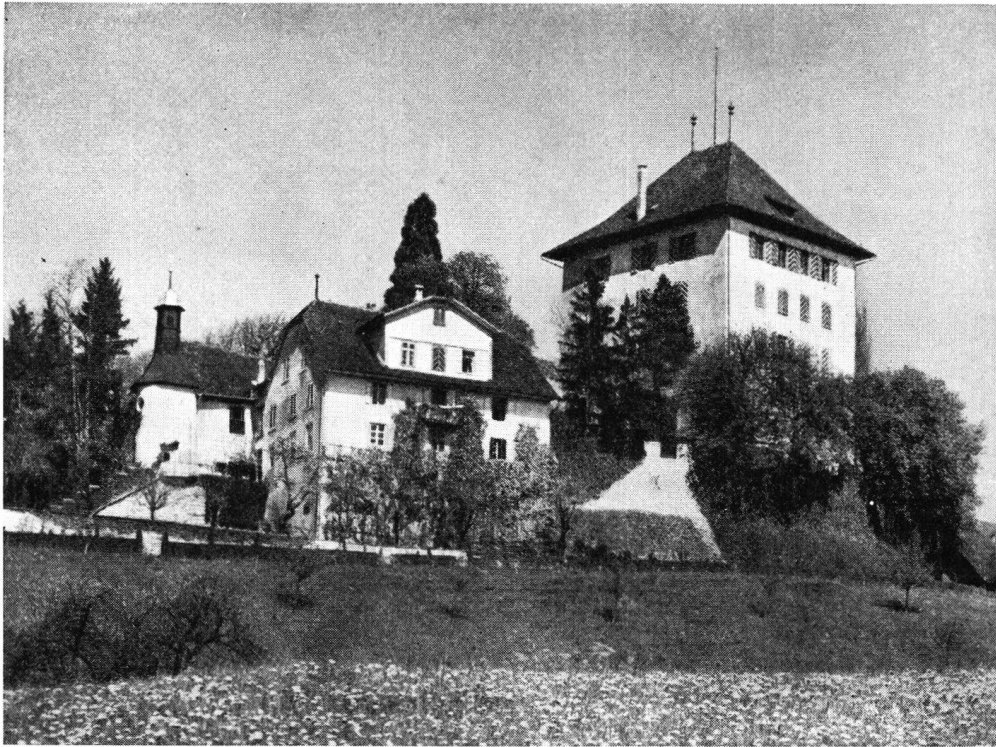
Burg Heidegg im luzernischen Seetal, die am ersten Tag besucht wird