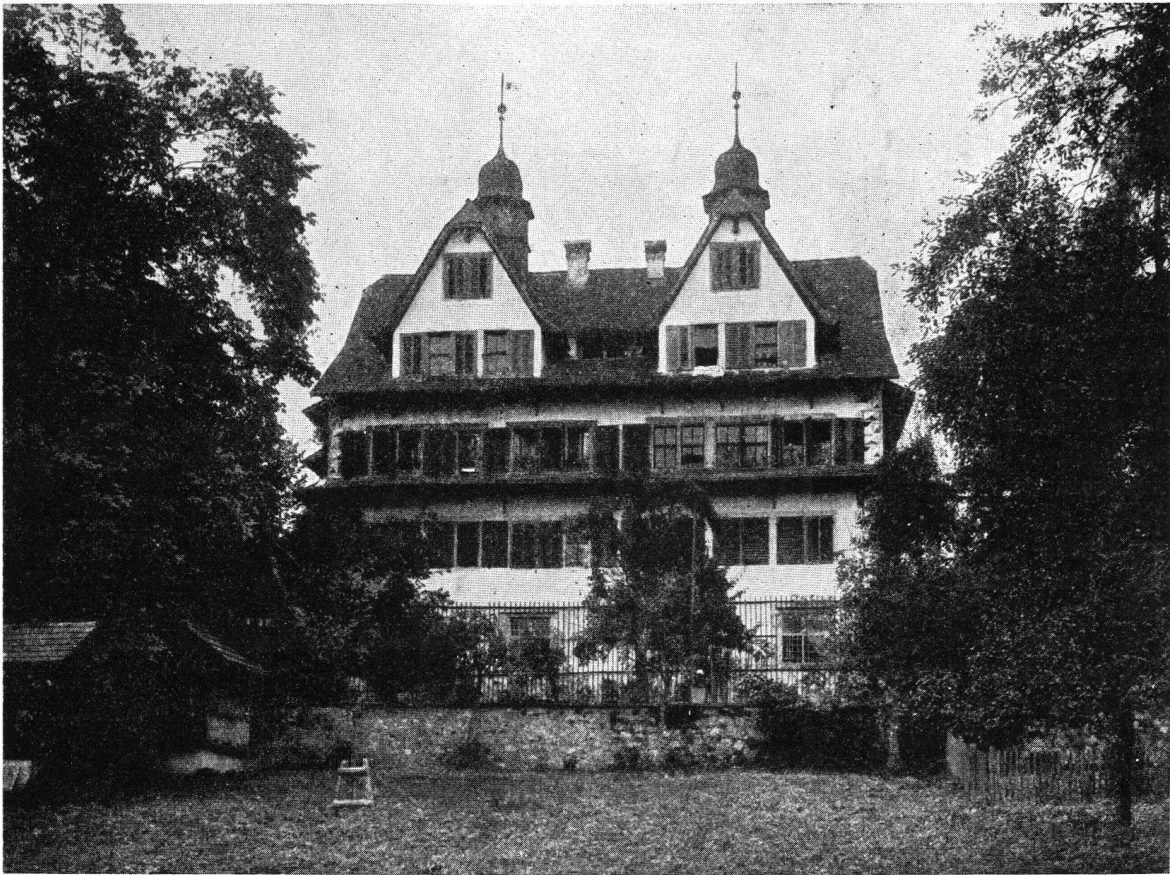
oben: Das Ital Reding Haus in Schwyz, wo ein Empfang stattfindet