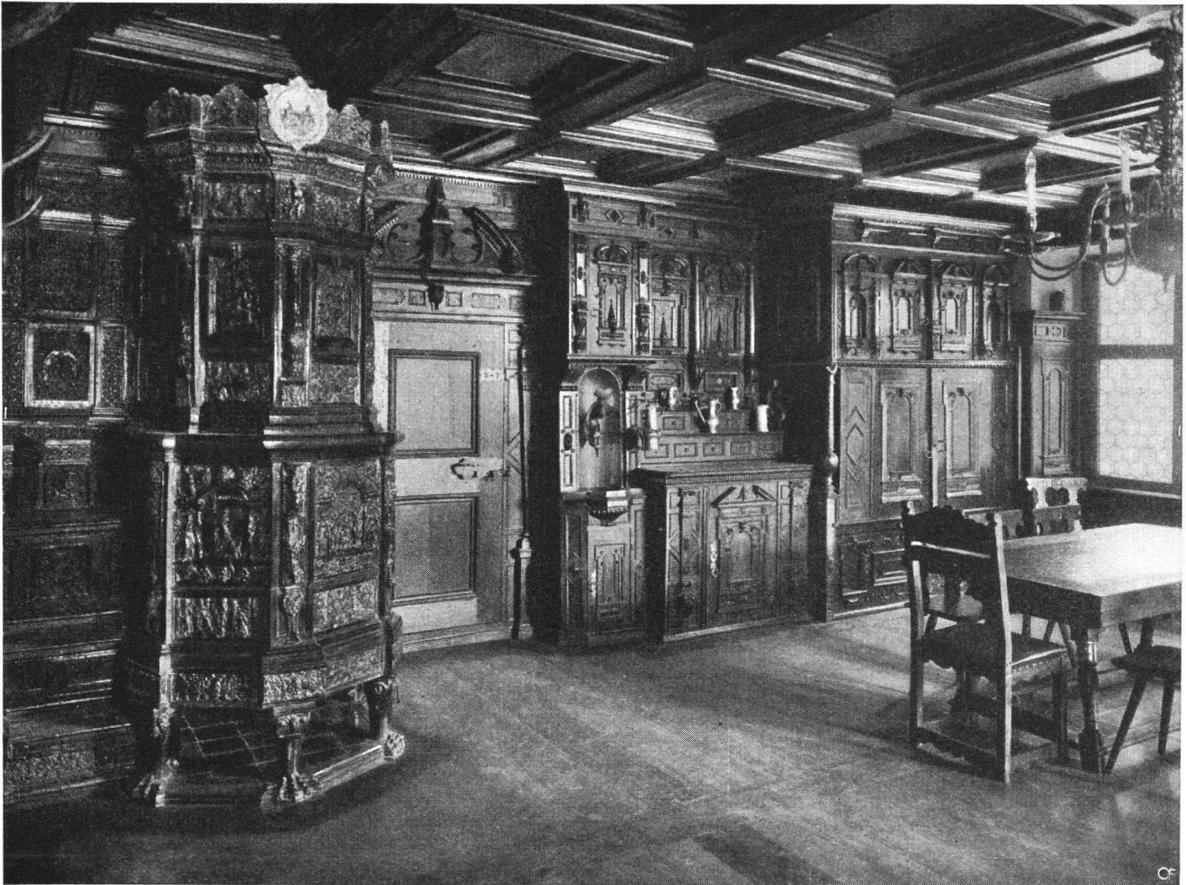
Prunkstube im Schloß Wülflingen