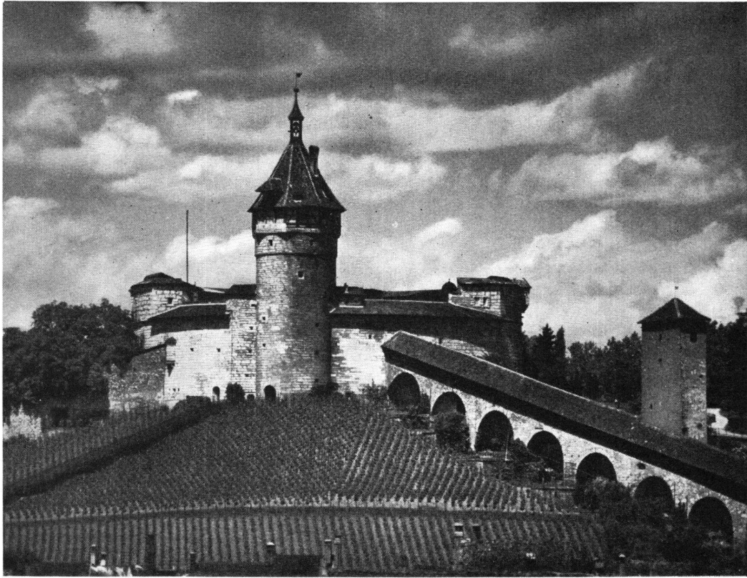
Der Munoth ob Schaffhausen