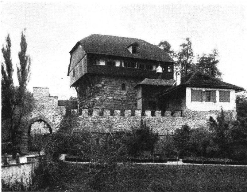
Burg Mammertshofen bei Roggwil