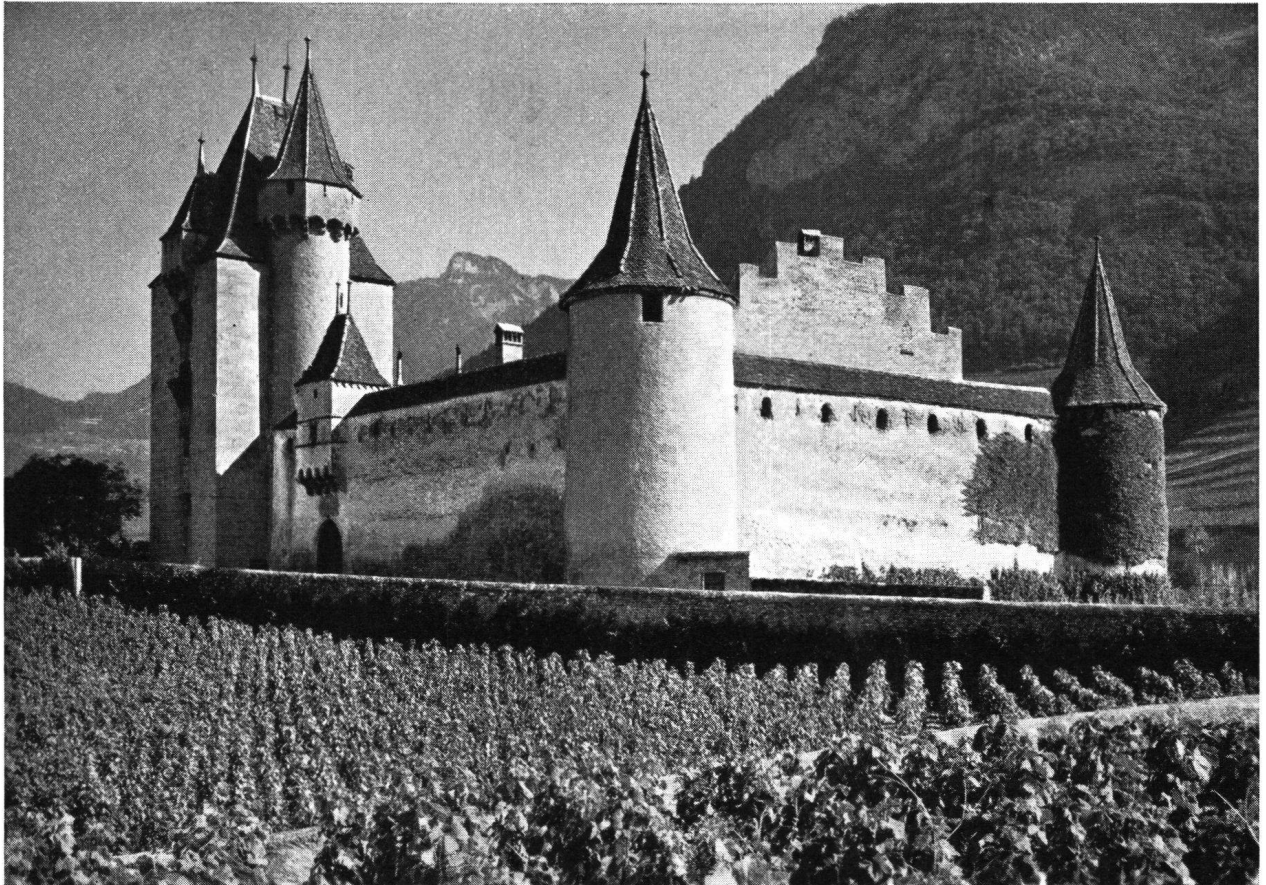
Le Château d'Aigle