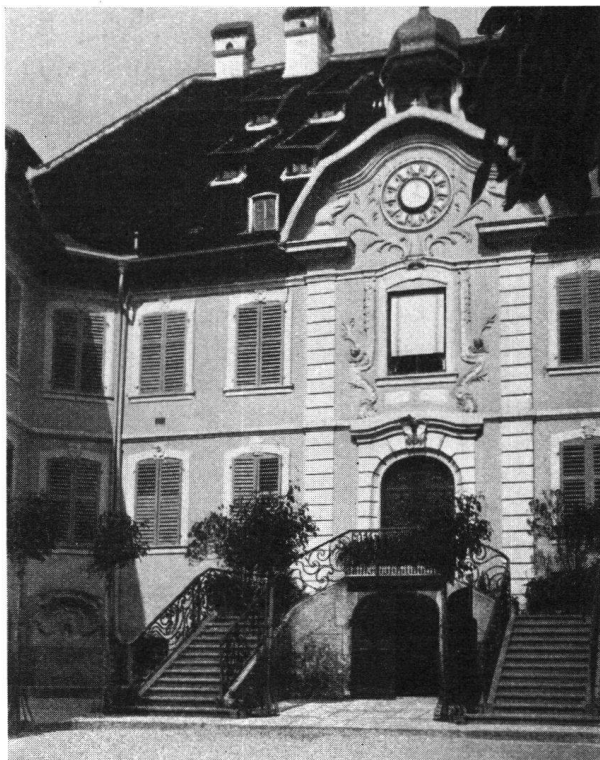
Teilansicht vom Spital der Stadt in Porrentruy (Pruntrut)

Teilnehmerkarte A Fr. 147.80 Teilnehmerkarte B Fr. 139.90