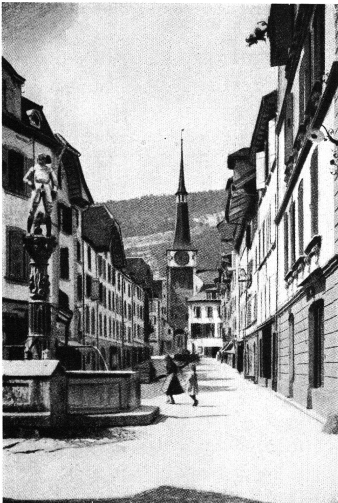
Aus dem „Bürgerhaus“

Das einst fürstbischöfliche Schloß Pruntrut (Porrentruy) in dem am letzten Tag das Mittagessen serviert wird