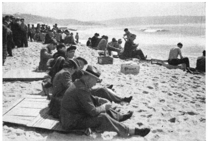
Am schönen Strand des Fischerdorfes Nazaré wird der mitgenommene Lunch verzehrt

Für das nächste Jahr ist eine Reise nach Schweden vorgesehen. Reisen ins Ausland mit einer größeren Gesellschaft erfordern heutzutage sehr viel mehr Zeit an Vorbereitungen als dies vor dem Krieg der Fall war. Die Verbindungen mit Schweden für die im Juli 1947 stattfindende Reise sind denn auch bereits aufgenommen worden.