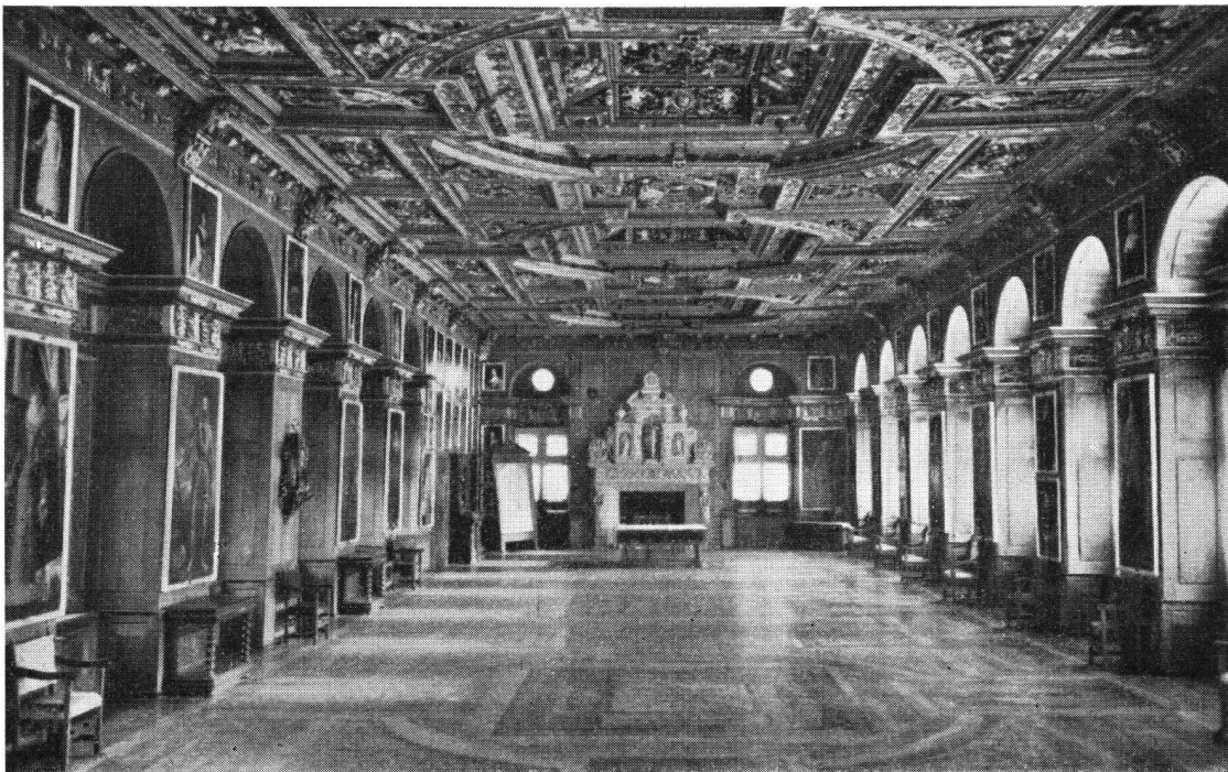
Schloß Heiligenberg. Der „Rittersaal“ gilt als der schönste Renaissance-Saal Deutschlands