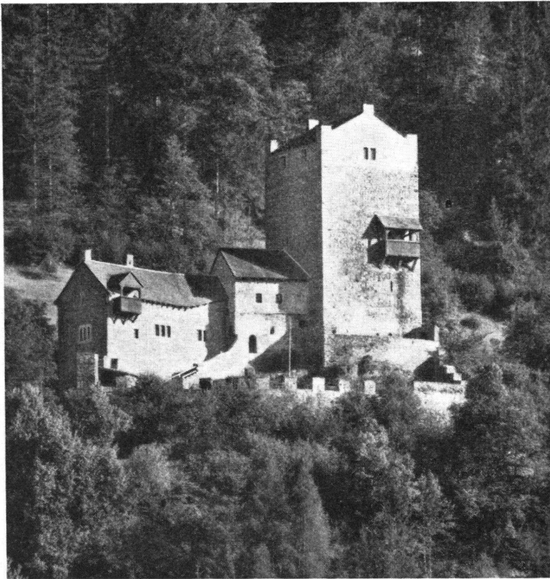
Ehrenfels ob Sils im Domleschg (Graub.). Eine schöne Aufnahme der dem Schweiz. Burgenverein gehörenden Burg, die an den Verein für Jugendherbergen Zürich vermietet ist.